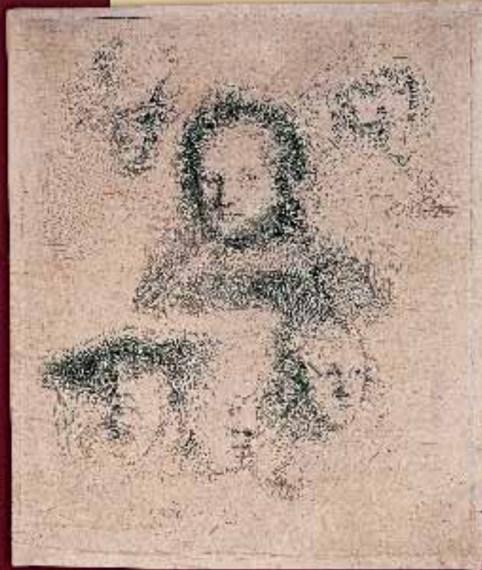
VLEVO Studie Saskie a dalších v technice leptu, kterou Rembrandt vytvořil roku 1636; © AKG-Images