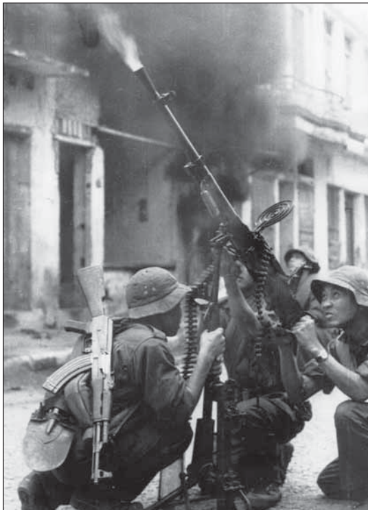
Příslušníci hlavních ozbrojených sil střílí na této fotografii z těžkého kulometu SG-43 ráže 7,62 mm (čínský vzor 53). Kulomet je zde použit jako protiletectká zbraň, snímek pochází z roku 1968, z období ofenzivy Tet. Za povšimnutí stojí nástroj k hloubení zákopů severovietnamské provenience.

Někteří lidé rádi podotýkají, že termín „Vietkong“ je nesprávný. Do jisté míry mají pravdu. Národní fronta osvobození Jižního Vietnamu ( Mat tran Dan toc Giai phong mien Nam Viet Nam – National Liberation Front – NLF) byla jak politickou organizací s vlastním správním aparátem, který vykonával vládu v některých oblastech Jižního Vietnamu, tak i ozbrojenou povstaleckou organizací. Jejím ozbrojeným křídlem byly Ozbrojené síly pro osvobození lidu ( Quan Doi Giai Phong Nhan Dan – People’s