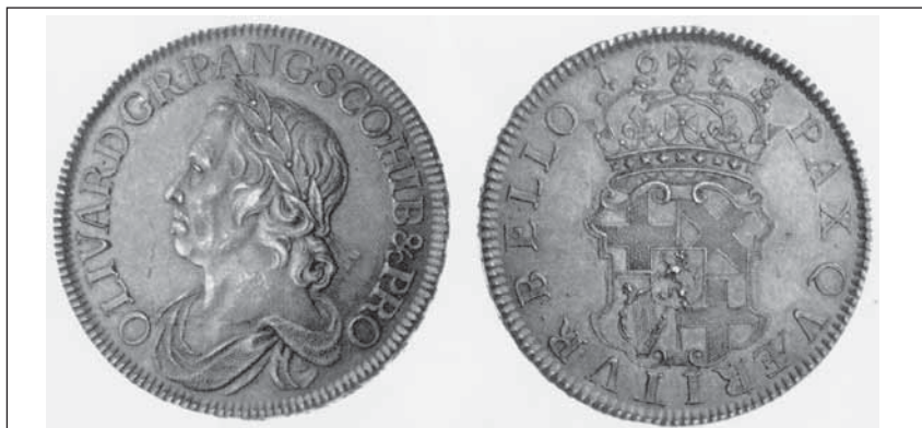
Oliver Cromwell, lord Protektor, 1658.

Pokud jde o výzbroj, výcvik a život anglického pěšáka, byla tato doba svědkem přerodu středověkého světa ve svět moderní. Úloha a význam vojáka vyzbrojeného palnou zbraní