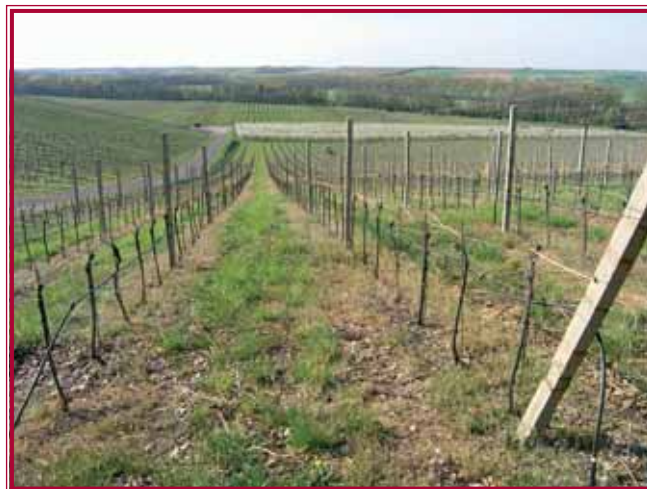
1.2. Vinice U tří dubů ve Stožkovicích

Vinohradnictví a vinařství v České republice zaznamenává v posledních několika letech nebývalý rozvoj. Plochy vinic dosáhly k dnešnímu dni téměř 20 tisíc hektarů. Vinice jsou vysázené a obdělávané moderním způsobem s využíváním nejnovějších mechanizačních prostředků. Vinohradníci pečlivě dohlížejí na kvalitu hroznů a snaží se ve vinici dopěstovat hrozny, které budou základem výroby kvalitních vín.