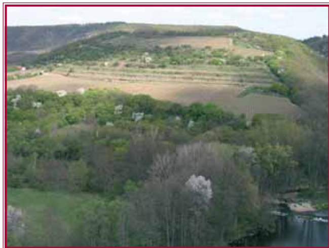
1.1. Vinice Šobes