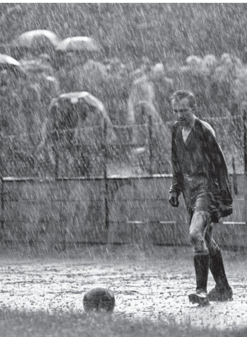
Obrázek Ú.2: Brankář a voda autor: Stanislav Tereba

Technický vývoj na přelomu 50. a 60. let minulého století přinesl dlouhé světelné teleobjektivy a s nimi i nové možnosti. V rámci World Press Photo byla několikrát sestavena speciální porota jen pro hodnocení sportovních fotografií. Světový úspěch slaví i česká jména, Stanislav Tereba se svou fotografií Brankář a voda získal v roce 1958 na soutěži World Press Photo první cenu v kategorii Sport a zároveň celkovou Hlavní cenu. Kromě toho byl snímek v témže roce vyhlášen i Světovou novinářskou fotografií.