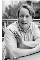
Obrázek 2: Linus Torvalds – zakladatel a vedoucí vývoje jádra