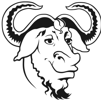
Obrázek 3: Logo hnutí GNU

Jediný dosavadní model vývoje a prodeje softwaru byl model proprietárního , tedy vlastněného a uzavřeného softwaru, který jsme popsali výše. Model svobodného softwaru naopak zohledňuje jeho nehmotný charakter – charakter informace . Tento software nikdo nevlastní, tak jako nikdo nevlastní například matematické vzorce či vzorce chemických sloučenin. Autorům projektu GNU – zkušeným programátorům – šlo především o možnost upravovat dodaný software podle vlastních potřeb a sdílet úpravy i software s ostatními stejně, jako sdílíme jiné informace. Autorské právo přitom zůstává autorům softwaru zachováno.