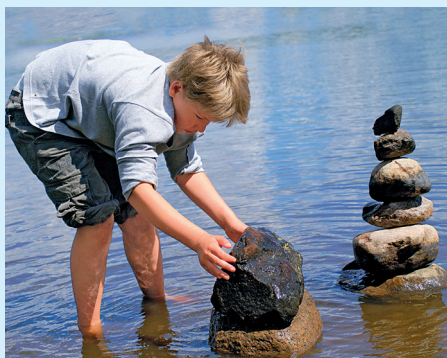
Kameny často najdete samozřejmě v přírodě.

Horniny (jak odborně kameny nazýváme) jsou tvořeny jedním nebo více druhy nerostů (minerálů). Nerosty se však v různých horninách nevyskytují pouze v podobě minerálních směsí různé zrnitosti (jemnozrnné až hrubozrnné). Mohou také v přírodě volně narůst, jako například křišťál. Někdy můžeme najít v zemi i zbytky a otisky rostlin nebo živočichů, kteří zemřeli, nebo dokonce již vyhynuli. Těm pak říkáme zkameněliny.