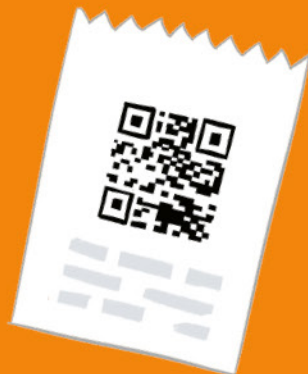
Lístek s QR kódem.