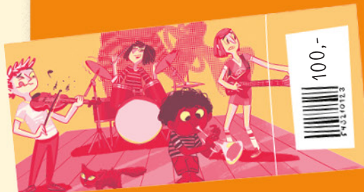
Lístek s čárovým kódem.

Určitě sis někdy všiml, že zboží v obchodech má na sobě jakési černé čárky. Je to jednoznačný kód každé věci v obchodu. Takový otisk prstu. Může v něm být zakódovaná cena a typ zboží, aby se vědělo, kolik takových výrobků v obchodu ještě zbývá a kolik máš u pokladny zaplatit. Někdy se používají i čtverečkové kódy, často se jim říká QR kódy. Do těch si můžeš zakódovat třeba i odkaz na webovou stránku, kterou si pak přečteš pomocí chytrého telefonu.