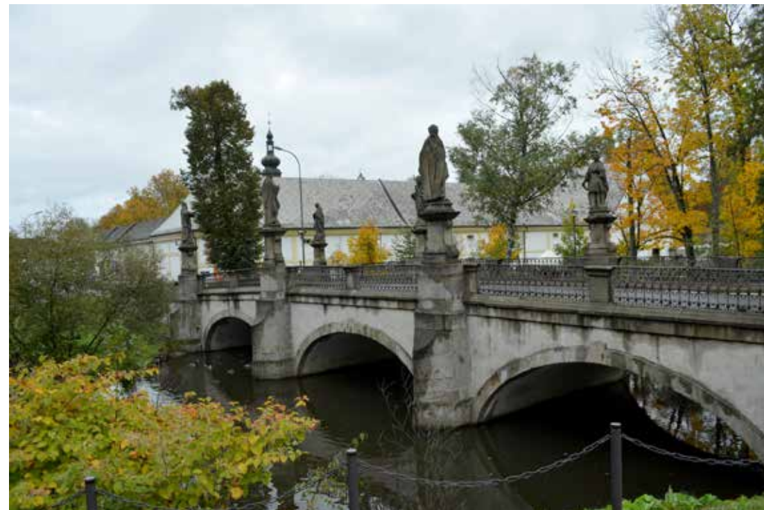
Kamenný most ve Žďáře nad Sázavou se zámek v pozadí

a kamenem, symbolizujícím hranici mezi nimi. Lev a orlice se dívají opačnými směry a naznačují tak, že mezi nimi neprobíhá žádná komunikace. Jejich výraz lze popsat jako zavilý (tvůrce Michal Olšiak). Zvláštní pohled si zasluhuje samotná socha hranice. Nemá žádný rozpoznatelný tvar, její obrysy jsou nejasné. Což přesně vystihuje skutečnost. A nemá podobně zarputilý, až sveřepý výraz jako její sousedé. Vlastně nemá výraz vůbec žádný. Nestojí tady v heroickém gestu, které by neslo nadčasový, nebo jakýkoli jiný význam. Existuje ovšem také možnost, že orlice se lvem zaujali takovouto pozici proto, aby demonstrovali připravenost bránit naši společnou zem před