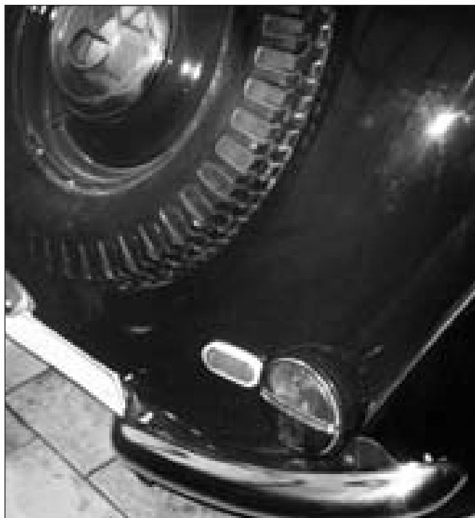
Takové koncovky se do roku výroby tohoto vozidla určitě také nehodí