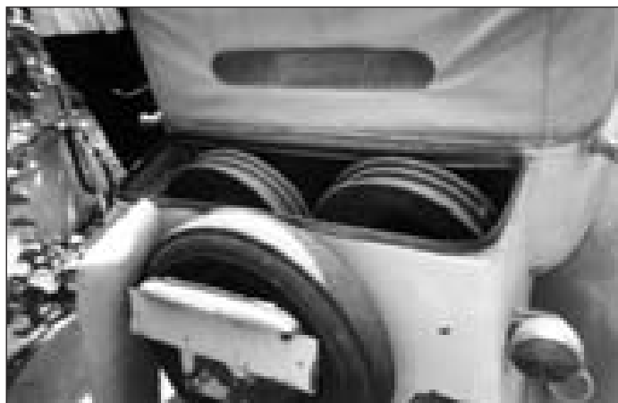
Ani osvětlení na vozidle určitě není originální. Ještě štěstí, že někdo nevyhodil ta správná kola, které na auto patří, a přiložil je do kufru

vodní chybí nebo vůbec nebyly. Přístroje, kontrolky a spínače na přístrojové desce jsou použity z jiného vozidla, nebo úplně chybí. Volant, aby podtrhl sportovní charakter, je podomácku vyroben.