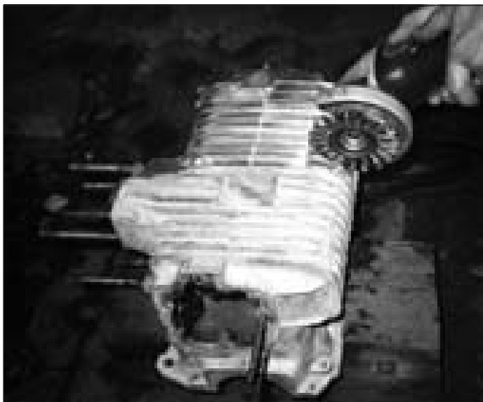
Pro čištění hliníkových skříní použijte ocelový kartáč na rozbrušovače

Musíte počítat s tím, že kupujete-li vrak vozidla od majitele, který není obchodník s veterány, ale prostě se rozhodl, že mu staré auto již překáží, prodává vozidlo v takovém stavu, které kdysi dojezdilo a v průběhu životnosti bylo postupně modernizováno tak, aby uspokojilo požadavky všech, kteří jej provozovali. Zjistíte například, že osvětlení vozidla jako například koncovky, osvětlení SPZ a většinou i směrová světla jsou již z daleko modernějších vozidel a pů-