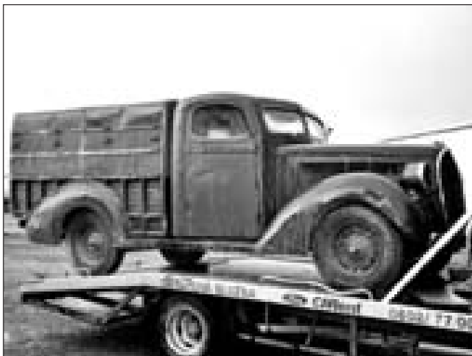
Těžší vozidlo, jako například tento pick-up – si nechte raději odvézt odtahovacím vozidlem

Na samotný odvoz vozidla si rezervujte dost času. Prodávající většinou totiž teprve po vašem příjezdu začne uvolňovat přístup k vozidlu a hledat další spoustu dílů, o kterých tvrdí, že je k vámi kupovanému vozidlu připraví. Ve zbytečném chvatu se pak spousta dílů zapomene. Většinou již nenávratně. S chladnou hlavou zavzpomínejte, co všechno vám majitel k „vraku“ slíbil a v klidu vše naložte. Na diskuse nad krásným strojem, který jste zakoupili, budete mít dost času, až vozidlo nanosíte do dílny nebo garáže.