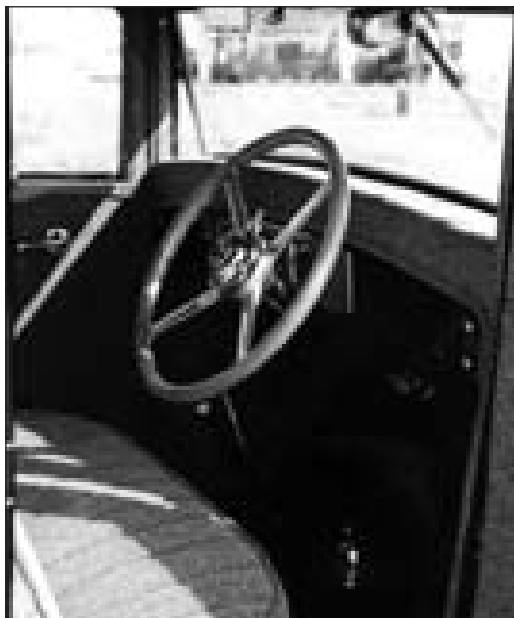
Klíčky a páčky musí být na hotovém vozidle pochopitelně funkční