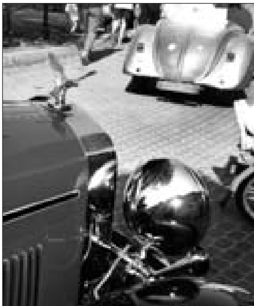
Plastiky a doplňky nesmí chybět