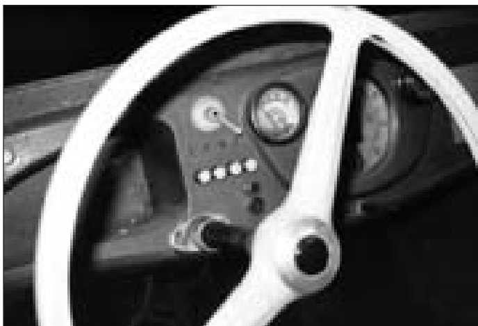
Většina těchto ovladačů a přístrojů určitě do tohoto vozidla nepatří. Také volant neodpovídá zcela určitému roku výroby automobilu