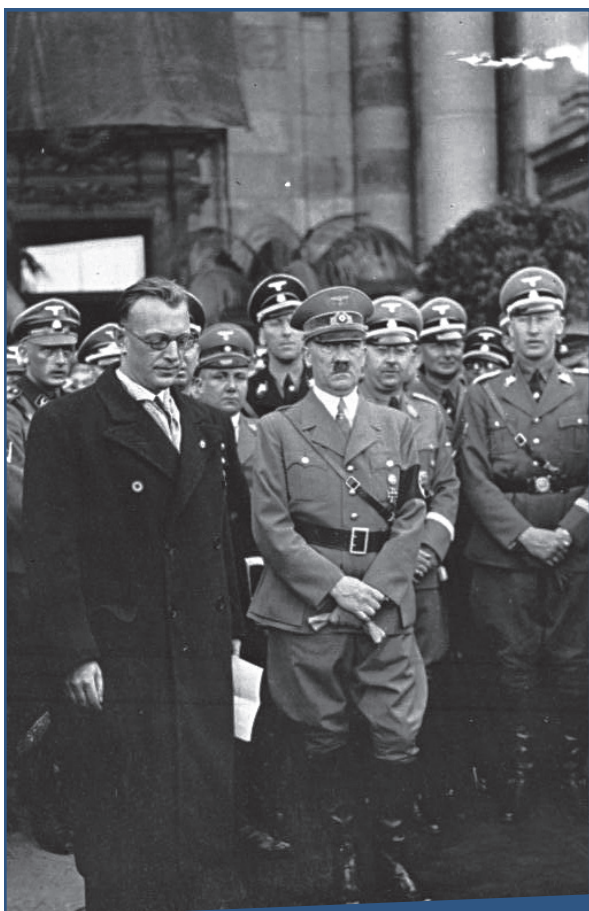
K. Henlein a A. Hitler

Na závěr své Zprávy Henlein požádal, aby „sudetoněmecká otázka byla řízena přímo z Berlína“, přičemž současně konstatoval, že „srozumění mezi Čechy a Němci je v Československu prakticky nemožné“. Tím se dal plně i se sudetskými Němci k dispozici Hitlerovi a nacismu. Politický vývoj SdP se od listopadu 1937 do léta 1938 přizpůsobil nacistické verzi „völkischpolitiky“, tedy rozbití ČSR a připojení „českého prostoru“ k Velkoněmecké říši pomocí války v součinnosti s SdP coby „páté kolony“.