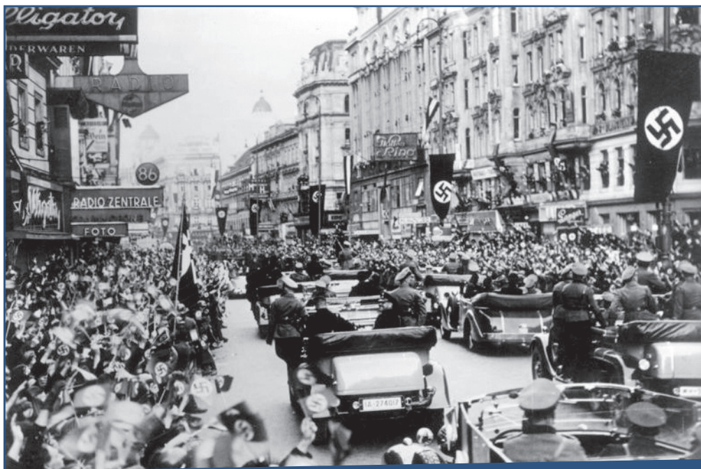
Vítání německých jednotek ve Vídni

V Rakousku musel spolkový kancléř Kurt von Schuschnigg odvolat připravované lidové referendum o připojení země k Třetí říši, 11. března 1938 jmenoval kancléřem Seyss-Inquarta a večer již německý wehrmacht překročil hranice Rakouska (nutno říci, že nadšeně vítán velkou částí obyvatelstva). Vše proběhlo hladce a rychle i proto, že demokratické vymoženosti byly v Rakousku již od roku 1934 suspendovány.