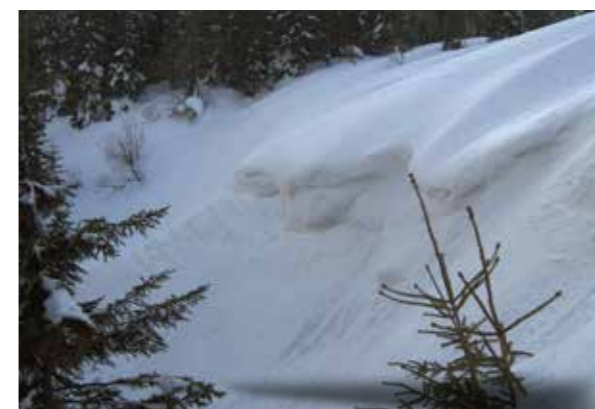
Odtrhová zóna ve Velké lavinové roklí.

Odhadem víc než třičtvrtě hodiny. Sníh musel být hodně porézní, jinak by neměl šanci. Smůlu