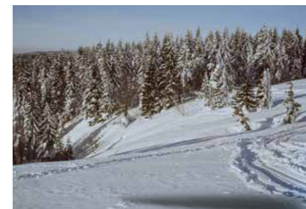
Část plochy louky, ze které se sníh ukládá ve Velké lavinové roklí.

Šli bychom tam s vyhledávači, měli bychom sondy a lopaty, lavinové batohy – sami bychom byli lépe chráněni. Asi bychom dokázali líp zorganizovat naše kroky na místě. Ale i tak, o moc rychleji bychom ho z toho prašanu vykopat nedokázali. A vrtulník, to je v takovém případě samozřejmost. Tehdy i dneska. Tím, že pravidelně podobné situace v rámci lavinové prevence Horské služby nacvičujeme, získáváme rutinu, abychom všechno, pokud se děje i něco nestandardního, dokázali zvládnout co nejlíp, abychom uměli improvizovat i v podmínkách, které jsou nějak mimořádné.