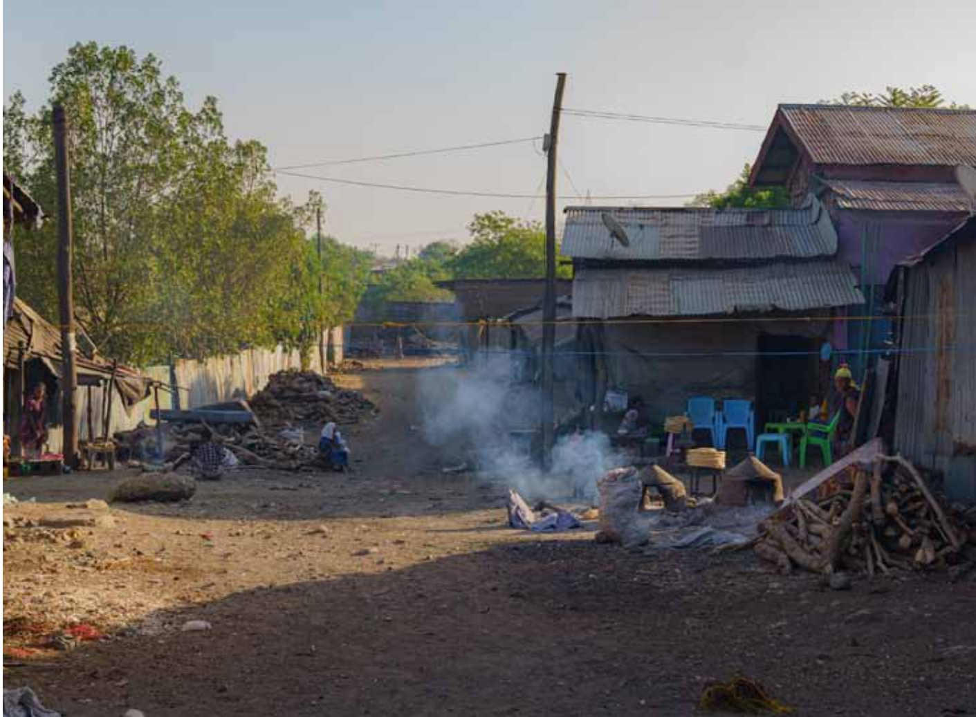
▲ Uličky v etiopské Metemmě