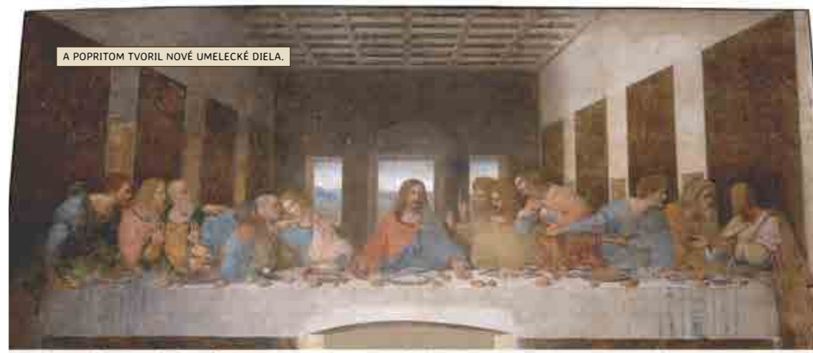
A POPRITOM TVORIL NOVÉ UMELECKÉ DIELA.