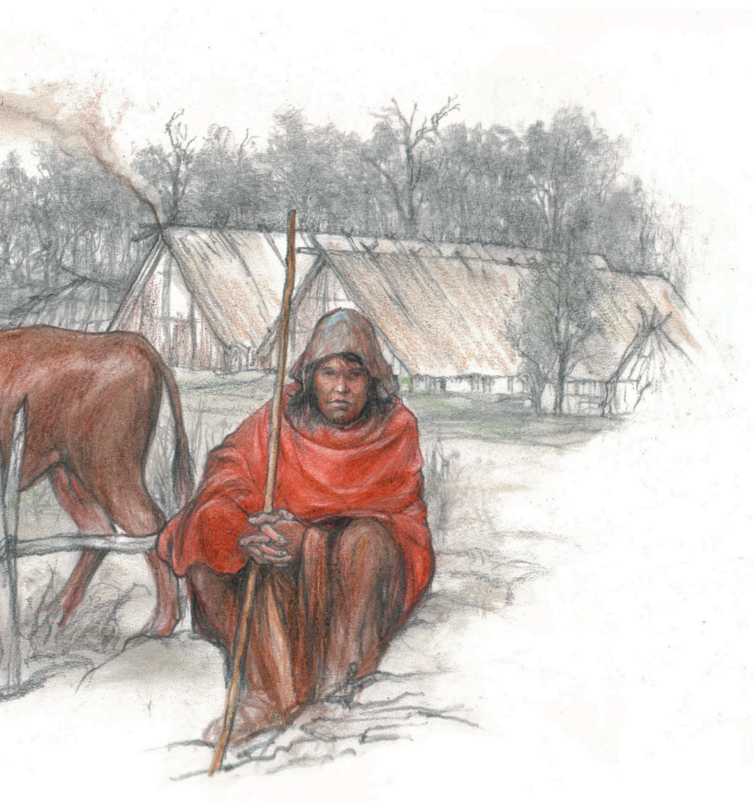
Vesnice prvních zemědělců