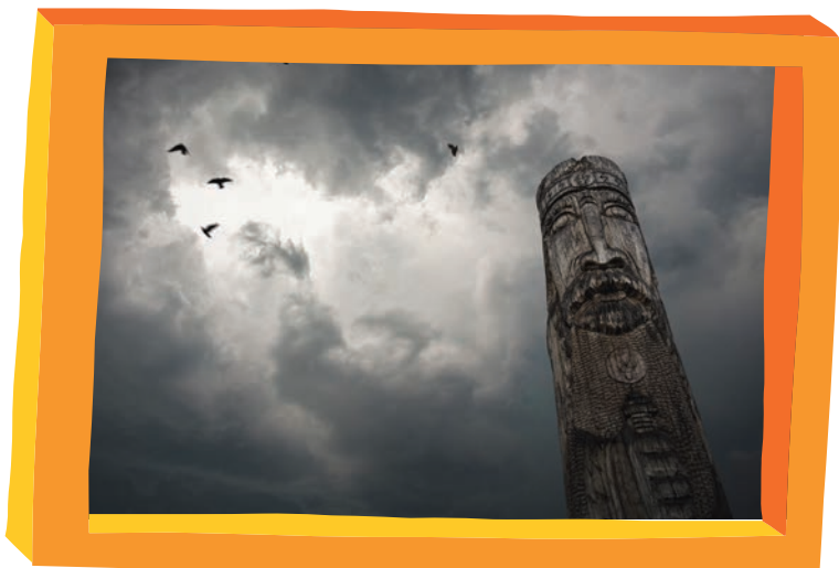
slovanský bůh Perun

Donedávna uznávaný dub si to „schtal“ už v díle našich obrozenských autorů. Např. Ján Kollár ve vydání básnické skladby Slávy dcera z roku 1832 píše: „Jakýs vepřík přivázaný k dubu / z Lipska od lip a škol lipšťanských / přišlý, na žaludech germánských / i zde válí se a pase hubu.“ Takže dub dostal postupně od Čechů na frak a v revolučním roce 1848, kdy si Němci na tzv. Frankfurtském sjezdu zvolili oficiálně za národní strom opravdu dub, na Slovanském sjezdu v témže roce byla naopak zvolena lípa.