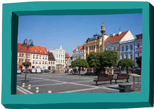
město Česká Lípa

Česká Lípa není jen město v severních Čechách. Lípa je český národní strom a také patří k tradičním symbolům našeho státu, ale zdaleka ne tak dlouho, jak by se mohlo zdát. Posvátný strom Slovanů (stejně jako většiny Evropanů) byl vždy dub. Nejvýznamnější bůh Slovanů se jmenoval Perun (bůh hromu, tedy bouřky, to jistě vzbuzovalo respekt) a strom, který staří Slované prokazatelně uctívali, byl dub. Jenže to se nehodilo našim předkům v době českého národního obrození. Zhruba do konce 18. století bylo totiž obyvatelům našich zemí celkem jedno, jakým jazykem, kdo hovoří. Třenice i kruté války