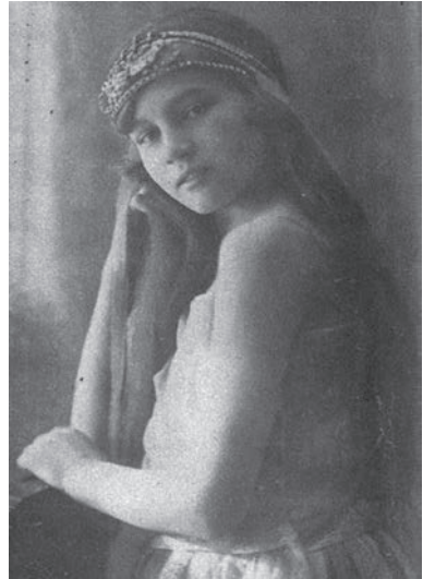
Královna lesních žinek

le pojal vůči Jirkovi zřejmou nechuť. To ovšem jenom zvýšilo matčinu bezmeznou lásku pro jejího prvorozeného, která se během let vyvinula v lásku opičí.