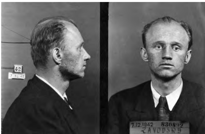
Jedním z komunistů, který se předtím tvrdě podílel na represích, ale zároveň se později stal obětí, byl někdejší šéf Osvald Závodský, popravený v roce 1954.

byli ti lidé v první fázi výslechu, tak odešli na celu a tam si jakoby oddechli, že se jim podařilo něco utajit, ale ten práškač to nahlásil operativci a ten pak vyšetřovateli. Takže oni v řadě případů věděli, co ten člověk skrývá nebo že někoho zamlčel nebo kde se ještě dají nalézt důkazy. A to bylo dovedeno až do konečné fáze procesu a potom byl odsouzen, spadl do vězeňského systému znovu, už ne ve formě vazby, ale do vězení nebo do lágru. A tam byl zase pod kontrolou toho státně-bezpečnostního aparátu, zase tam měli svou vězeňskou agenturu, zase tam měli na lágrech lidi, kteří byli na ně získáváni a úkolováni, a to z různých sociálních skupin. Toho člověka můžete skřípnout, vydírat, jak kvůli rodině venku, tak kvůli výhodám uvnitř toho lágru nebo ho zpracovávat ideově. Tudiž pro Státní bezpečnost a komunistickou moc byl v některých případech ten člověk – řečeno neosobně „objekt“ – nepřítelem, ať už se dělo cokoliv, až do smrti. A problém s těmito lidmi pro režim končil až jejich smrtí.