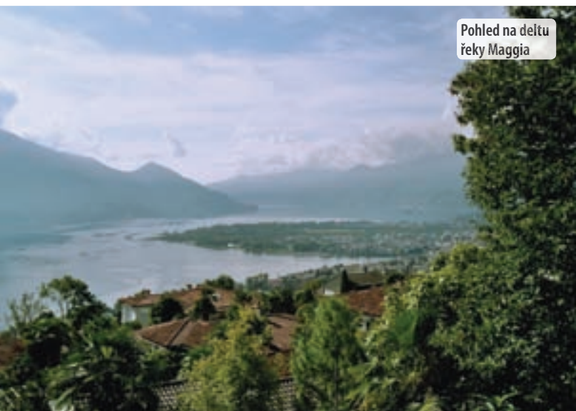
Pohled na deltu řeky Maggia

roku 1616 byl kostel přestavěn. V presbytáři se nachází rokokové štukatury a v klenbě vyobrazení svatého Augustina od Guiseppe Orelliho . Klášter je stavba o třech křídlech se sloupovými arkádami ze 17. stol.