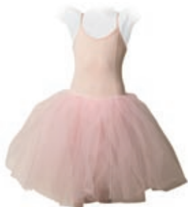
Kostým s ružovou sukňou (tutu)

Sukňa kostýmu (francúzsky: tutu, čítaj: tyty), u nás nazývaná aj balerína, je zložená z niekoľkých vrstiev tylových volánov. Kedysi zakrývala nohy až po členky. Počas rokov sa menila takým spôsobom, aby mohla lepšie vyniknúť technika nôh a silueta tanečnice. Ale či už v podobe dlhej sukne v období romantizmu, alebo krátkeho „taniera“ v 20. storočí, zostáva stále spolu so špičkami symbolom baletky.