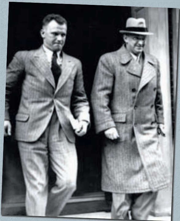
SdP v Londýně. Henlein (vpravo) několikrát navštívil Velkou Británii, kde přesvědčoval vlivné osobnosti a politiky, aby se postavili za sudetoněmecké požadavky.