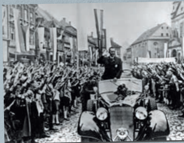
Henlein projíždí Chomutovem. Tento snímek vznikl ještě za existence Československa v létě roku 1938. Vedle sudetoněmeckých praporů proto vlají také československé státní vlajky. Avšak v duchu karlovarského programu SdP již plně převzala nacistický pozdrav vztyčenou pravicí.

Neklid v pohraničí před obecními volbami vedl v květnu 1938 československou vládu k vyhlášení částecné mobilizace . Z požadavku sudetoněmecké autonomie se stal mezinárodní problém. Do republiky přicestoval britský lord Runciman na zprostředkovatelskou misi, avšak postavil se za sudetoněmecký požadavek autonomie. Praha si už tehdy začínala uvědomovat, že zůstává ve svém úsilí čelit nacistické agresi osamocena.