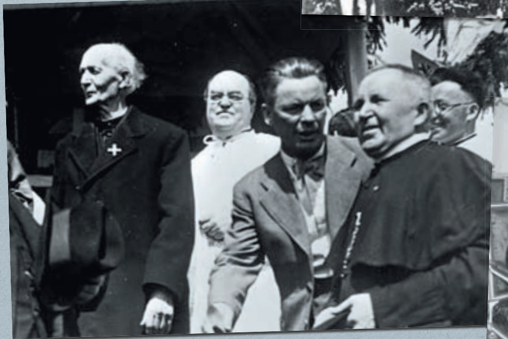
Slovenští autonomisté. Šéf Slovenské ľudové strany (SLS) Andrej Hlinka (vpravo) se skupinkou katolických duchovních na demonstraci za autonomii v centru Bratislavy. Červen 1938.