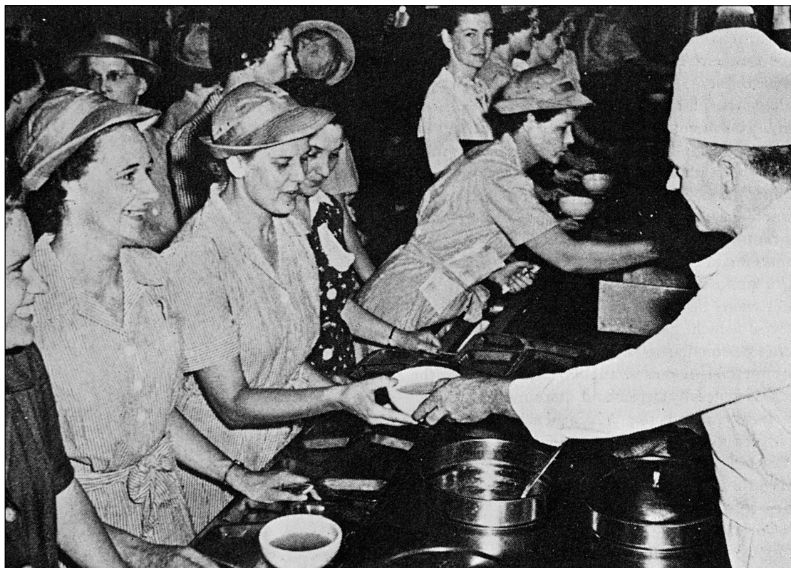
Rekrutky WAAC stojí ve frontě na „žvanec“; zpočátku dostávaly stejné přídělky jako muži, později jim byl příjem kalorií snížen s odůvodněním, že vydají méně energie než muži. Šaty ze světlé látky měly pásek, který se zavazoval vepředu; oblíbený byl klobouček typu „pudinková miska“.

12,5 dolaru, které dostávaly příslušnice WAVES každého čtvrt roku, jim údajně nestačily ani na punčocháče, natož na ostatní věci.