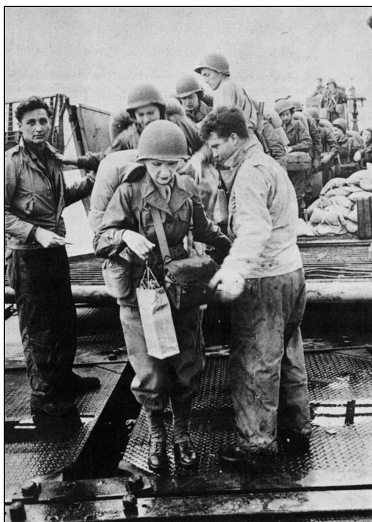
Americké armádní zdravotní sestry vystupují v Normandii z vyloďovacího plavidla. Mají na sobě polní oděv vzor 43, taktickou výstroj a přilbu, tedy stejné vybavení, jaké dostávali muži.

Nejrůznější modifikace ženských uniforem všech těchto složek probíhaly postupně po celou válku a bylo jich příliš mnoho, abychom je mohli v této knize všechny vyjmenovat. U WAC se všeobecně ujala vojenská čapka neboli lodička; roku 1944 přešla do běžného užívání v řadě lehce odlišných podob vlněná blůza do pasu, modelovaná podle britské polní uniformy, tzv. „ošizená blůza“. Ženy v uniformách sloužily v zámoří na mnoha bojištích, mimo jiné ve Středomoří, v Pacifiku a jihovýchodní Asii a v severozápadní Evropě.