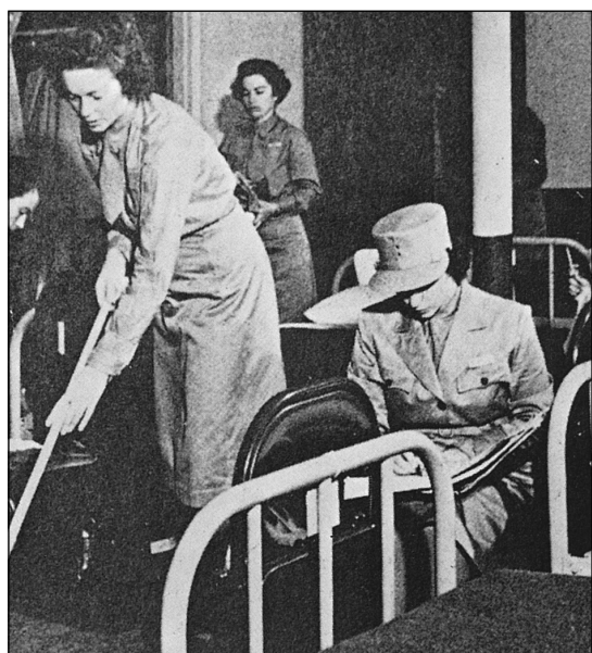
Příslušnice WAAC uklízejí svou ubytovnu. Blůza a kěpi jsou tady vidět zřetelněji; povšimněte si jmenovky nad levou náprsní kapsou, kterou nosili všichni rekruti.

Námořnictvo se vyhnulo největším obtížím s oblečením, které trápily armádu, jednoduchým opatřením, když udělilo příslušnicím WAVES povolení zakoupit si vlastní uniformy. Různé komerční firmy byly pověřeny výrobou uniforem podle oficiálních specifikací, a ty se pak prodávaly ve velkých obchodních domech, které rovněž zajišťovaly odborné úpravy. Boty a další osobní položky se vybíraly z dostupných standardních komerčních modelů, a proto oblečení sedělo celkově lépe a bylo individuálnější. Příslušnice WAAC nakonec těžily z toho, že jim byly obnošené věci zdarma nahrazovány, protože příplatky ve výši