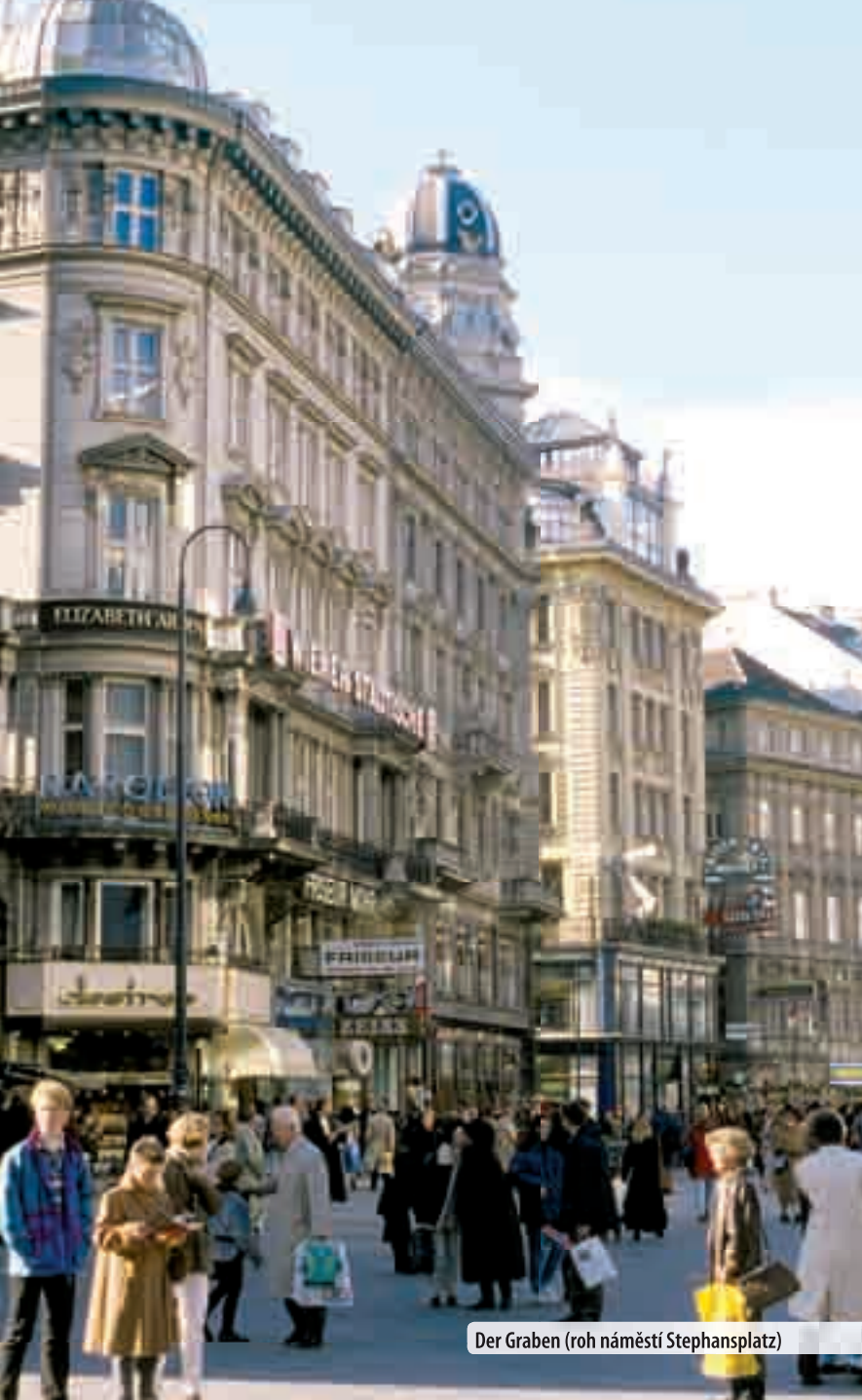
Der Graben (roh náměstí Stephansplatz)