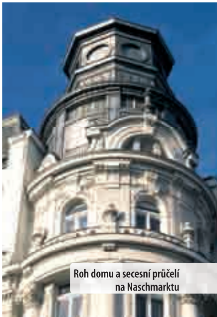
Roh domu a secesní průčelí na Naschmarktu

Otto Wagner , který se jako dítě své doby zajímal především o technická řešení, překlenul řeku Wien, aby umožnil monumentální západní vjezd do města. Z toho nebylo nic a z válečně ekonomických důvodů byl v roce 1916 zřízen Naschmarkt.