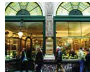
GALERIES ROYALES SAINT-HUBERT