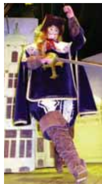
THÉÂTRE ROYAL DE TOONE