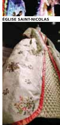
MUSÉE DU COSTUME ET DE LA DENTELLE