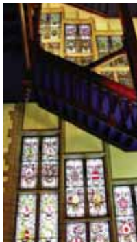
MUSÉE DE LA VILLE / MAISON DU ROI