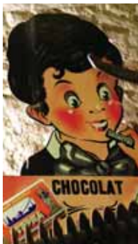
MUSÉE DU CACAO ET DU CHOCOLAT