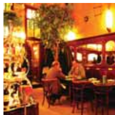
LA ROUE D'OR