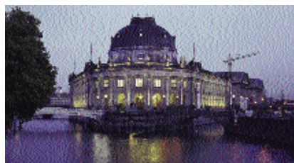
MUSEUMSINSEL / BODEMUSEUM