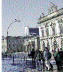
UNTER DEN LINDEN