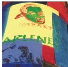
LUTTER & WEGNER