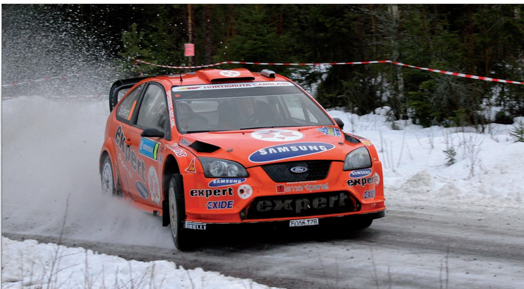
Atak Henninga Solberga na stupně vítězů vydržel jen polovinu soutěže, kdy zkušený Nor havaroval. Návrat do soutěže okořnil nejrychlejšími časy na všech zkouškách závěrečné etapy.