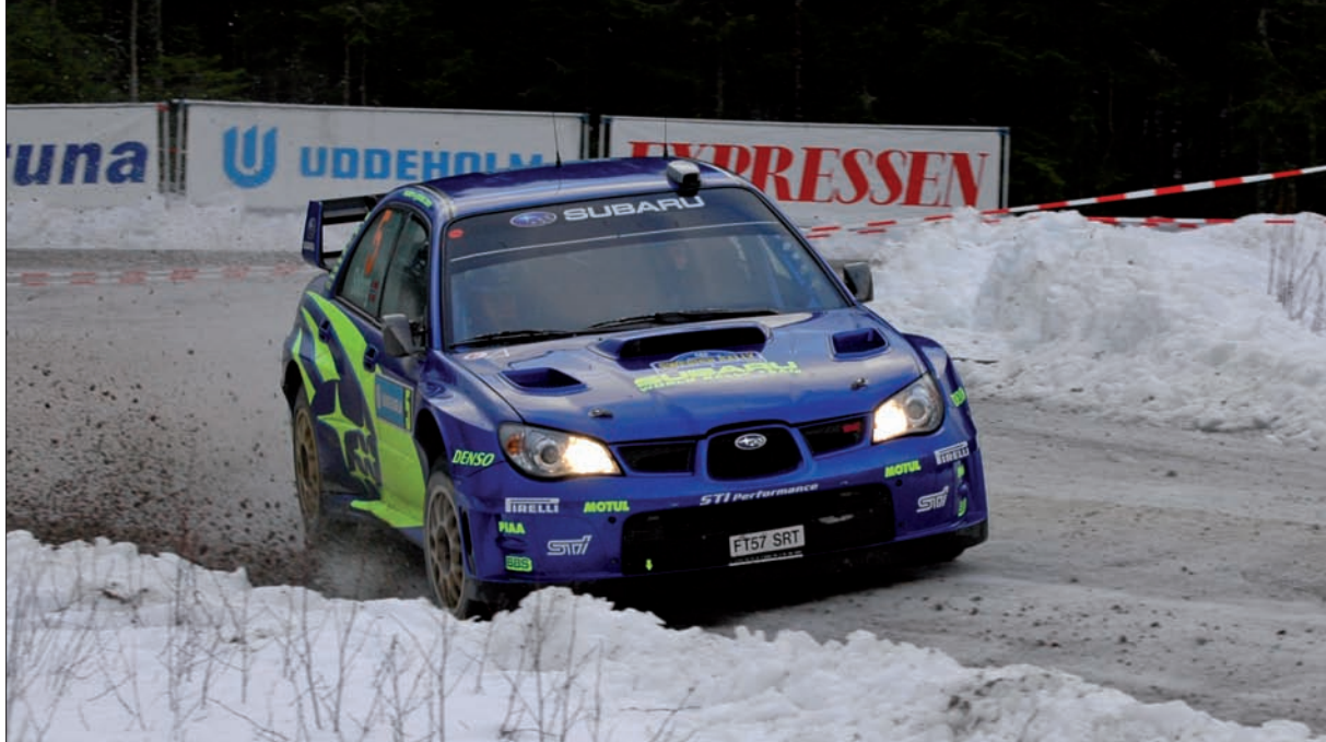
Petter Solberg se vrátil na místo činu. Právě před deseti lety ve Švédsku debutoval v rámci světového šampionátu.