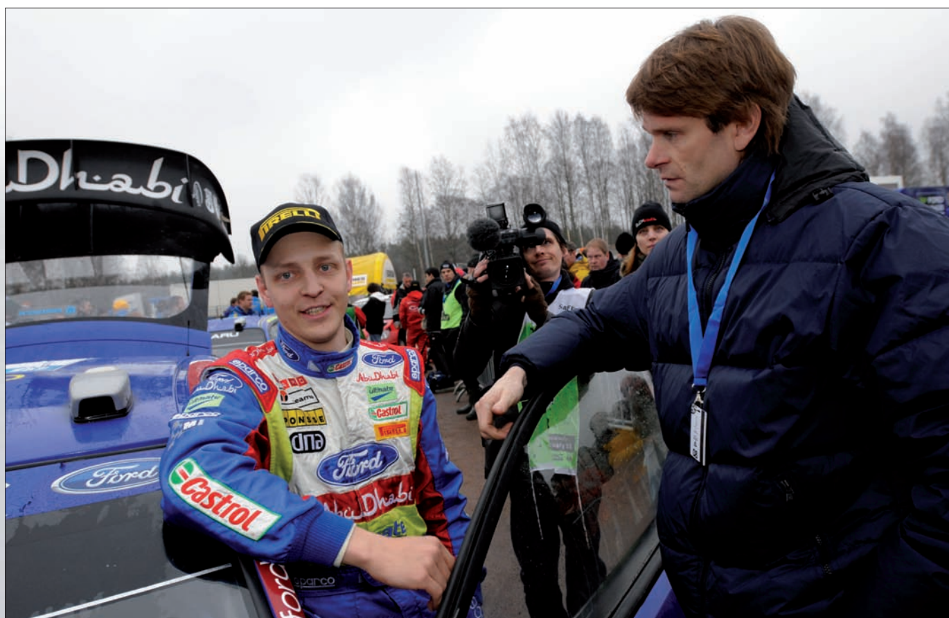
Mikko Hirvonen v rozhovoru se svým loňským týmovým kolegou Marcusem Grönholmem.