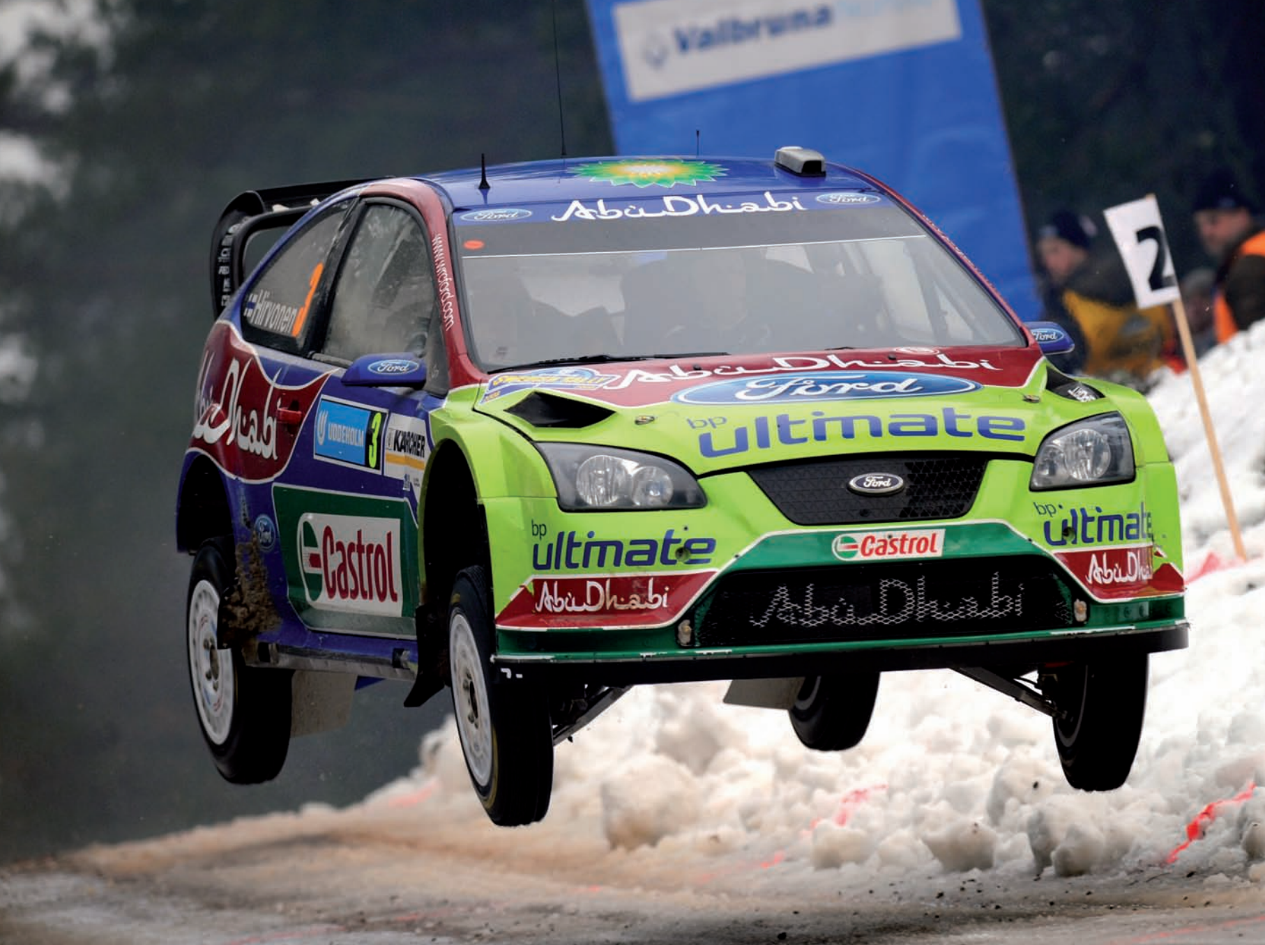
Na horizontu Colina McRae skočil nejdále tovární Ford. Nikoli však Mikko Hirvonen na snímku, ale Khalid Al Qassimi. Jeho let měřil úctyhodných 36 metrů.