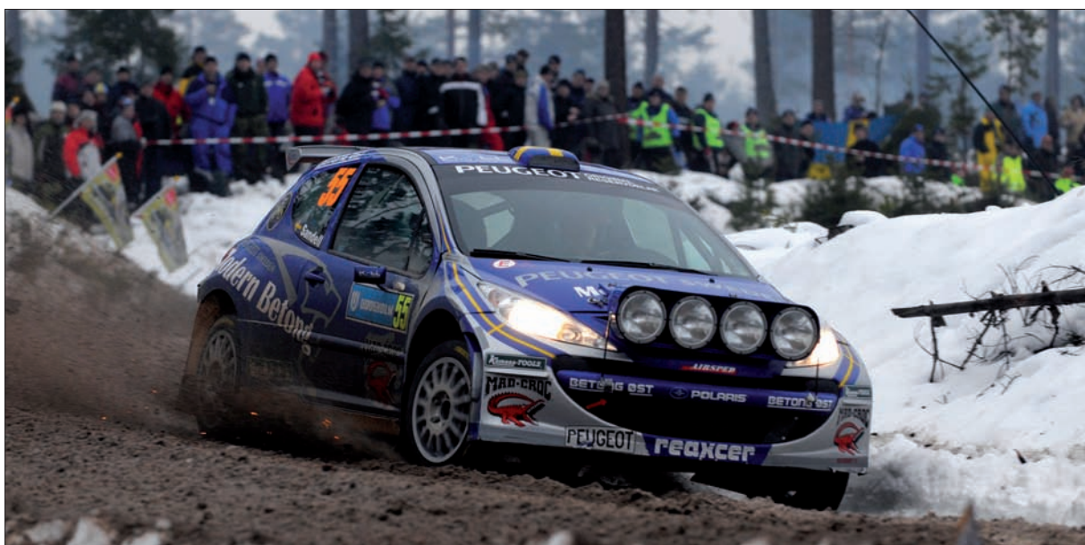
Světová premiéra Peugeotu 207 Super 2000 v rukou Patrika Sandella naznačila potenciál vozů této specifikace.