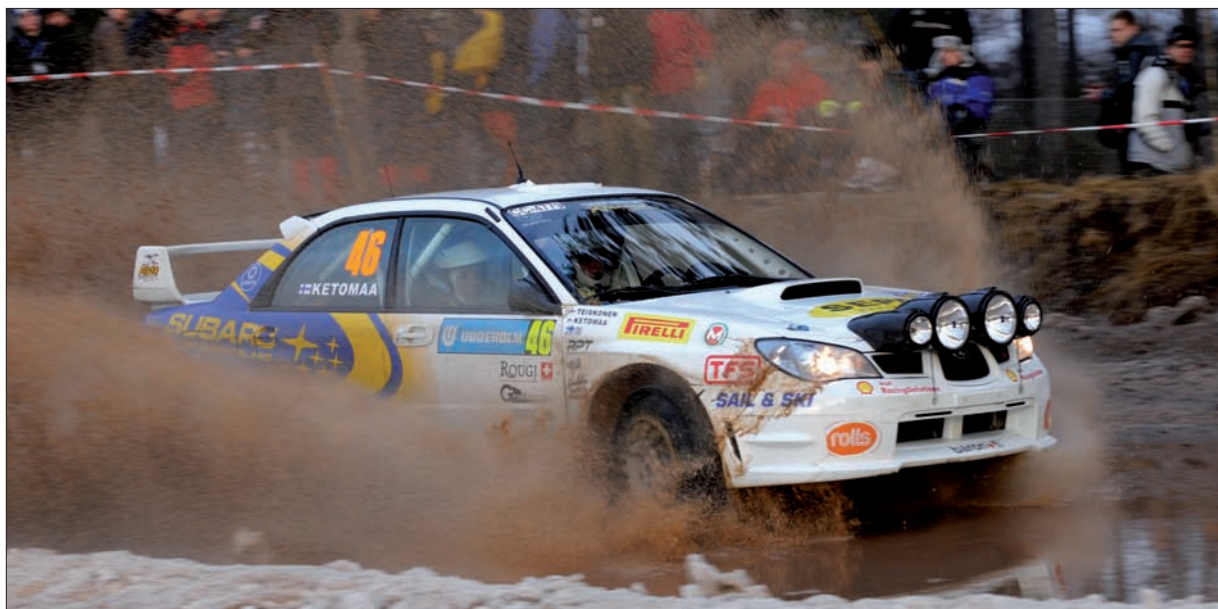
Seveřané opanovaly v PCWRC kompletní stupně vítězů. Druhé místo obsadila finská posádka Ketomaa - Teiskonen se Subaru Impreza.