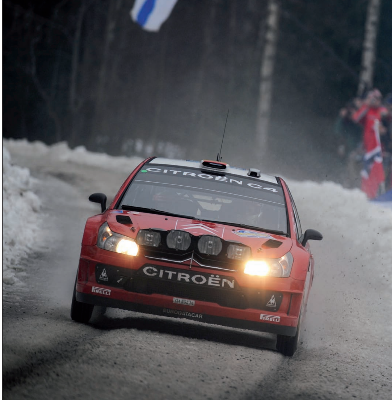
Posádkám stáje Citroën Total švédské tratě pořádně zhořkly. Dani Sordo obsadil až šestou příčku.