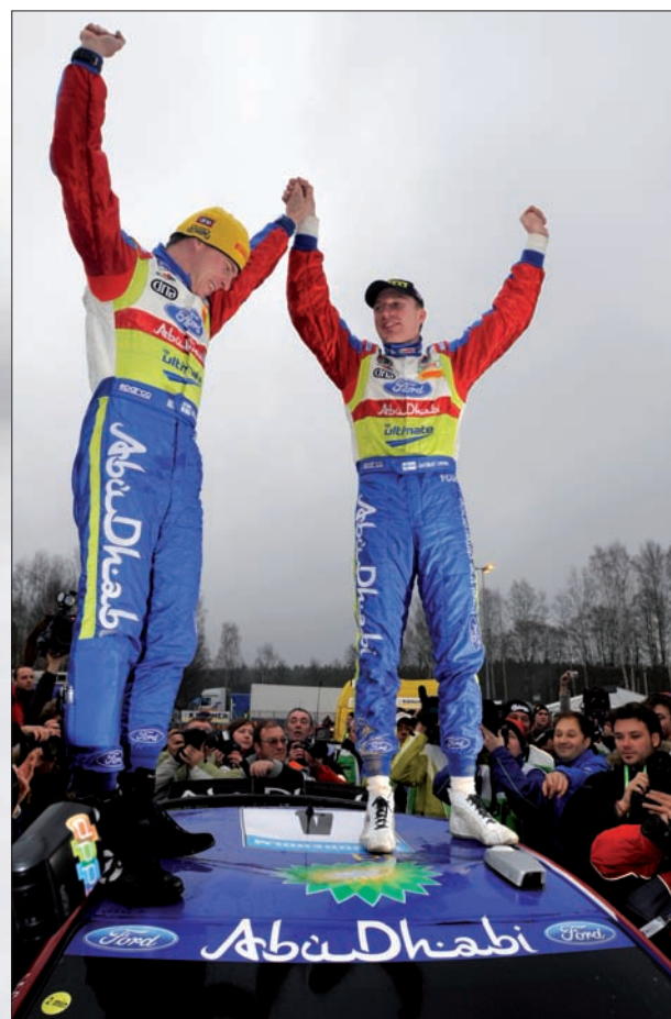
„Na tento den nikdy nezapomenu,“ reagoval Jari-Matti Latvala.