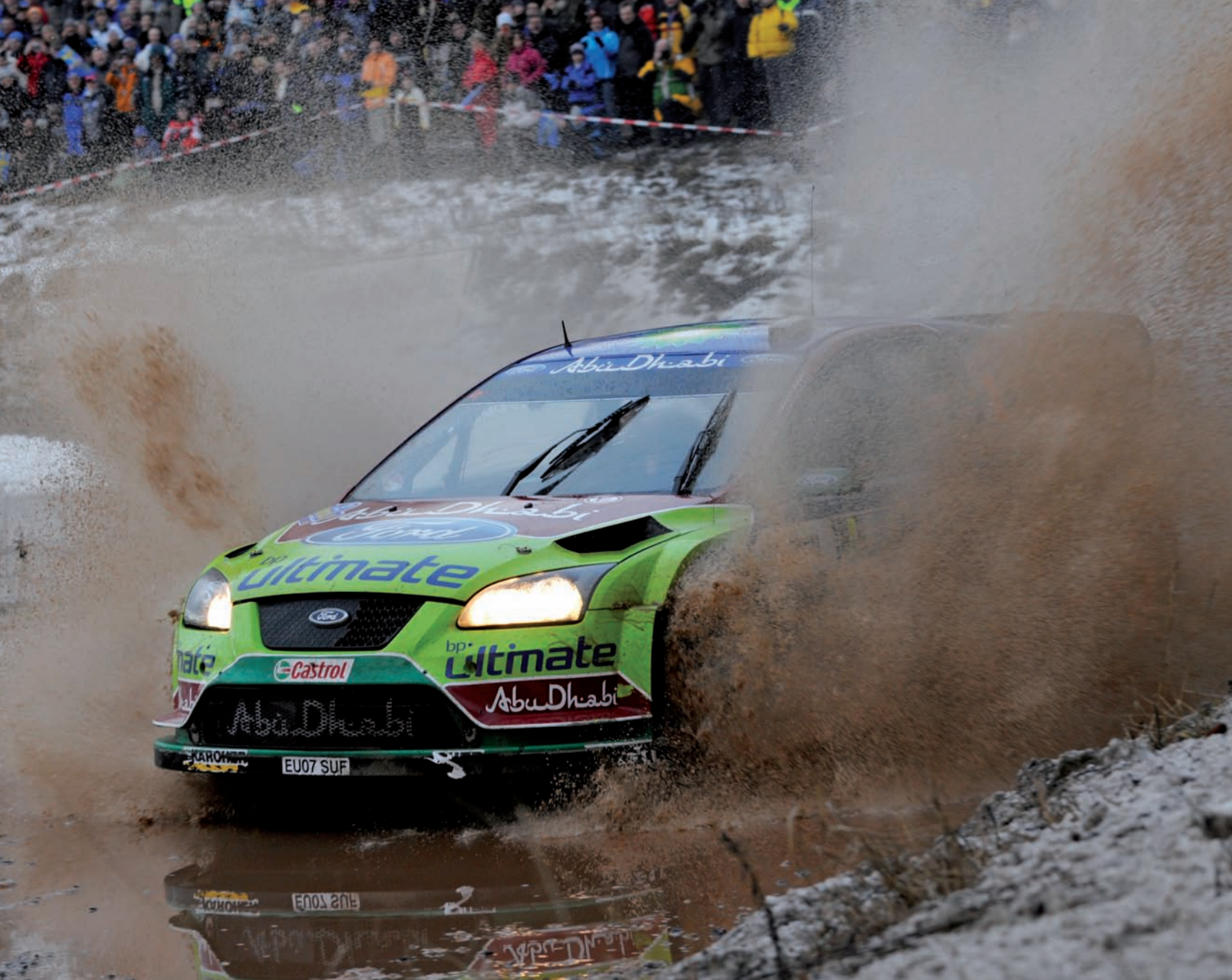
Jari-Matti Latvala zvítězil téměř stylem start – cíl. O tento primát ho připravil nejrychlejší čas P. Solberga na úvodní divácké speciálce.