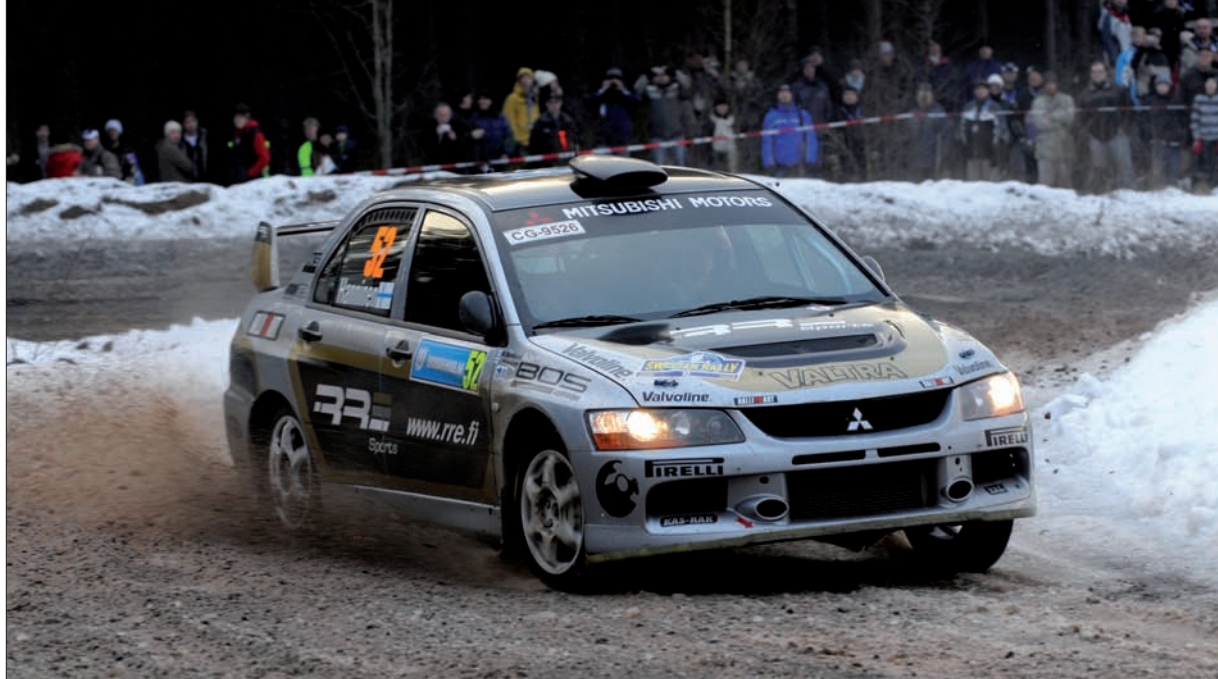
Juho Hänninen zúročil své sněhové zkušenosti a do produkčního šampionátu vstoupil s maximálním bodovým ziskem.