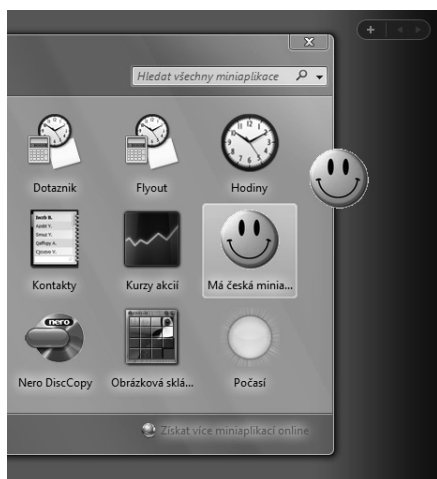
OBRÁZEK 5.5: Ikonka se zobrazuje také na kurzoru myši při přesouvání do panelu