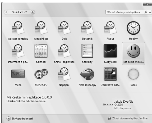
OBRÁZEK 5.6: Miniaplikace s rozšířeným řídicím souborem v Galerii miniaplikací