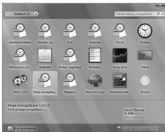
OBRÁZEK 5.1: Takto by vypadala naše miniaplikace v Galerii miniaplikací

V řídicím souboru nelze použít české znaky. Pokud bychom je vložili, stal by se soubor pro Postranní panel nečitelný a v Galerii miniaplikací by se vůbec nezobrazil. Nicméně, české znaky můžeme do Galerie miniaplikací dostat, a to pomocí tzv. entit HTML. Téměř každý znak má v HTML svou entitu, tedy krátký kód, který takový znak zastupuje. Postranní panel podle tohoto kódu pozná, jaký znak požadujeme a zobrazí jej. S entitou jsme se již setkali u značky XML <copyright> , kde jsme psali &#169; ; pro zobrazení znaku ©. Seznam českých entit HTML najdete v tabulce 5.1.