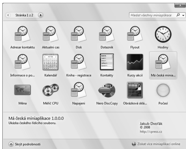
OBRÁZEK 5.2: České znaky v Galerii miniaplikací vytvořené pomocí entit HTML