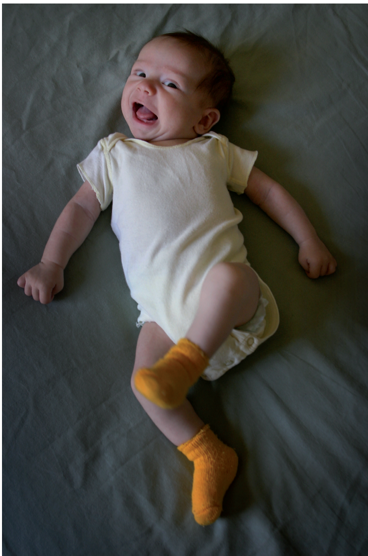
Obrázek 2.4 | Filip, 2 měsíce