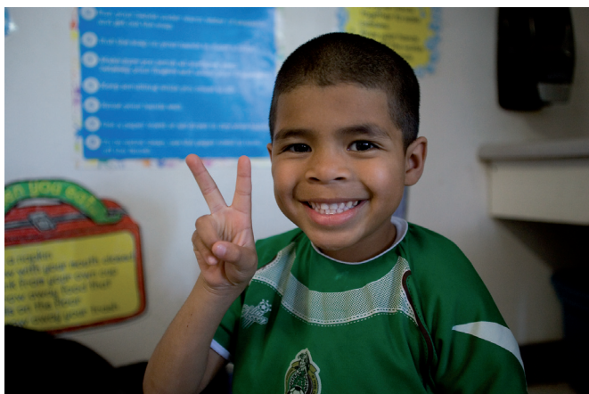
Obrázek 2.7 | Tento úsměv pro objektiv fotoaparátu patří k těm povedenějším