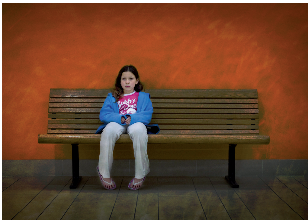
Obrázek 2.6 | Malá slečna nudící se na lavičce.