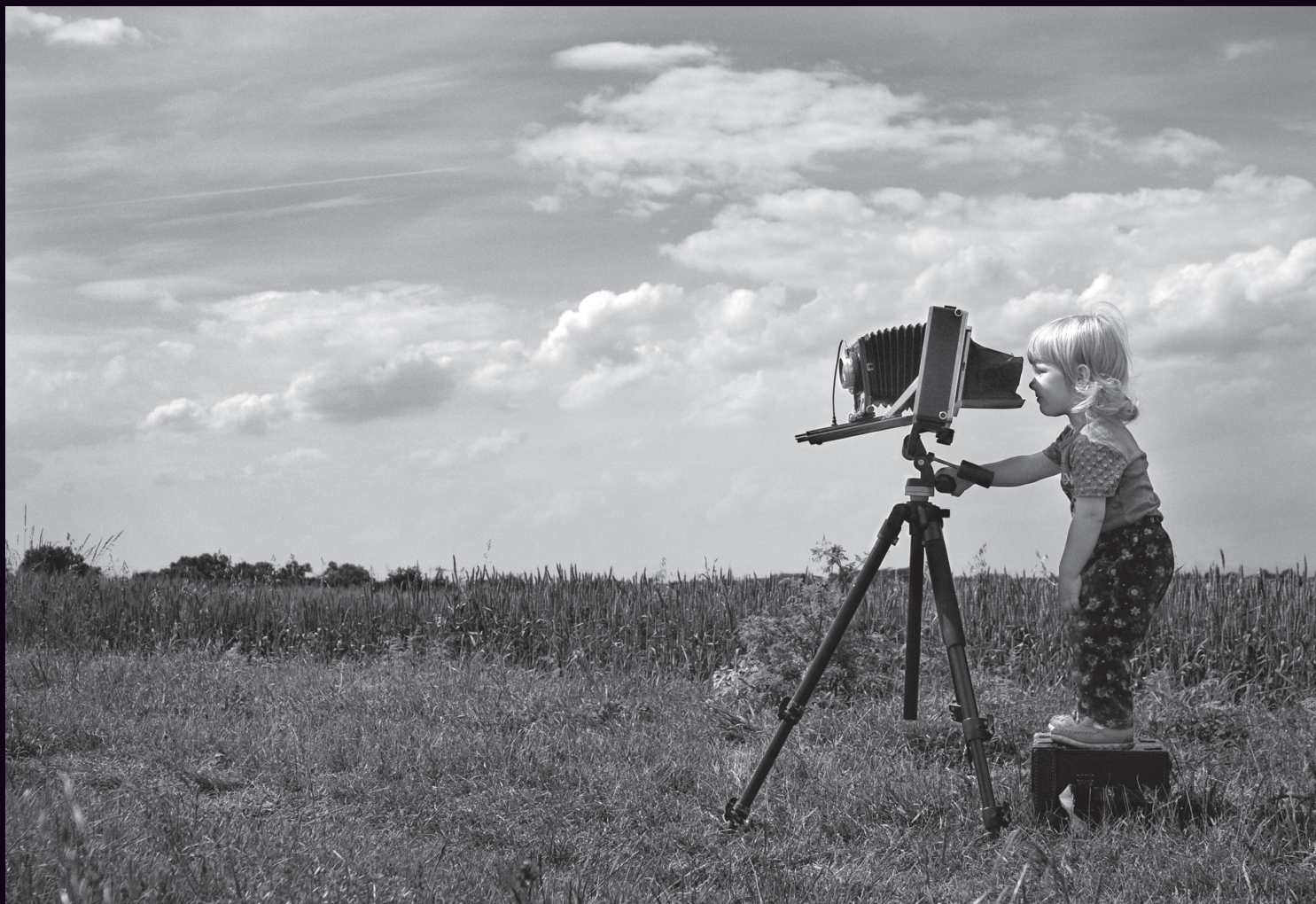
Obrázek 2.24 | Bětka fotografuje na velký formát.