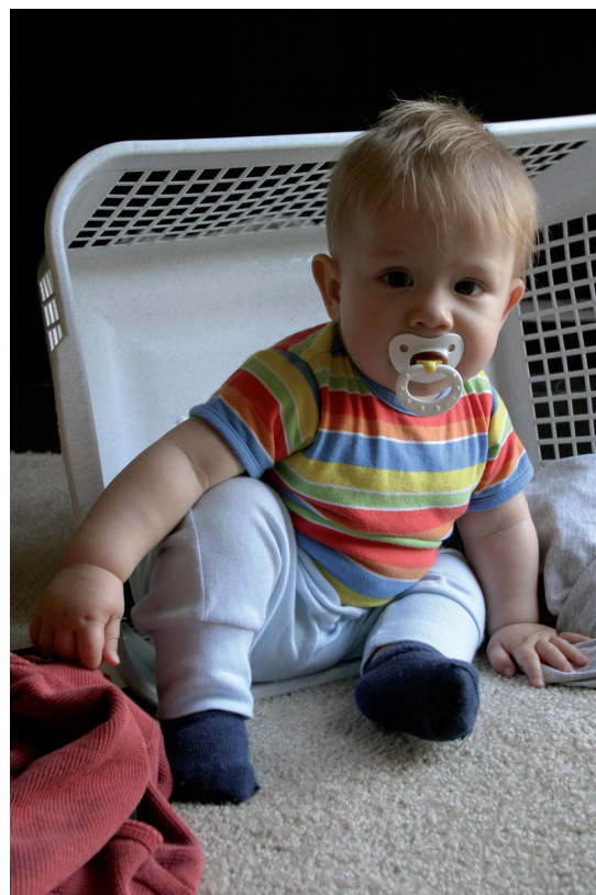
Obrázek 2.13 | Koš s prádlem dokáže být jako rekvizita velmi užitečný