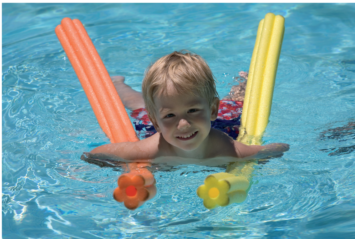
Obrázek 2.11 | V bazénu