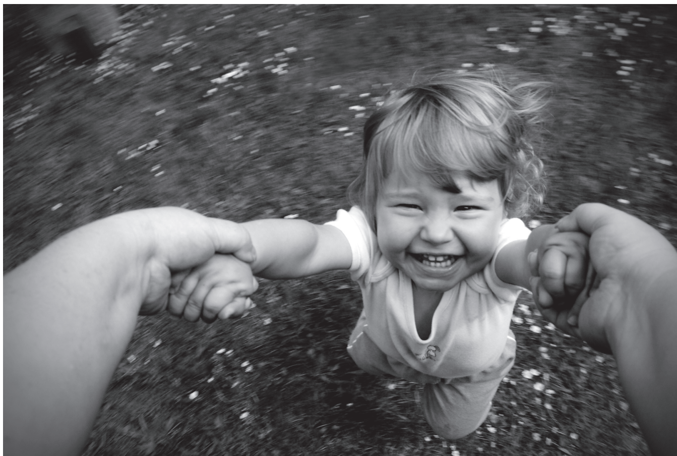
Obrázek 2.9 | Někdy se i asistent objeví na snímku.

I u hodně malých dětí, které ještě neutíkají pryč, nebo naopak starších dětí, které už jsou ochotnější setrvat na určeném místě, se ale asistent může hodit. Asistent vám může pomoci tím, že bude dítě bavit a bude se snažit zařídit, aby dítě dělalo to, co potřebujete. Vy se pak můžete plně soustředit jen na fotografování.