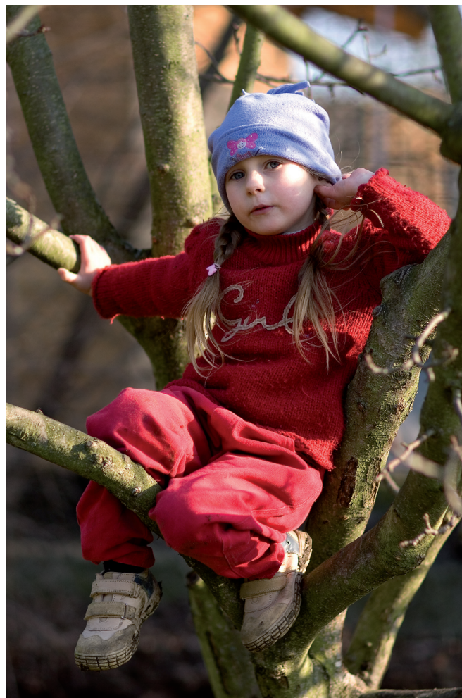
Obrázek 2.15 | Johanka, 4,5 roku.

Rekvizitu ale můžete použít i jen k tomu, abyste udělali fotografii zajímavější po výtvarné stránce. Jednou velkou skupinou oblíbených pomůcek při fotografování malých dětí jsou prádelní koše, krabice, obří květináče, kbelíky a všemožné jiné velké nádoby, do kterých jde dítě posadit. Nejenže často vypadají zajímavě, ale také dokáží poměrně spolehlivě dítě udržet alespoň chvíli na