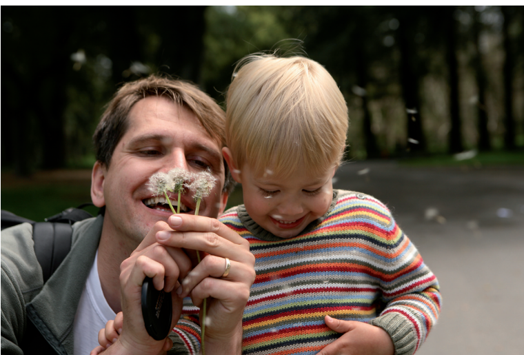
Obrázek 2.20 | Pampelišky

Starším dětem můžete i dovolit, aby fotoaparátem samy bez vaší pomoci zkusily něco vyfotit. Samozřejmě, že není možné nechat dítě, obzvláště menší, aby si s drahým přístrojem hrálo nekontrolovaně. Necháte-li ho ale fotoaparát dobře prohlédnout a dělat s ním s vaší pomocí alespoň něco, bude k němu mít hned kladnější vztah. Bude mu připadat méně cizí a strašidelný a nebude z něj mít takové obavy.