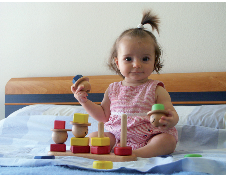
Obrázek 2.16 | Ráno jsou děti ještě nabitě energií.

Děti, obzvláště ty menší, mívají svůj pravidelný denní režim, na který jsou zvyklé a se kterým musíte počítat. Chcete-li se vyhnout nepříjemným scénám, nepokoušejte se k pózování nutit dítě, které je unavené nebo hladové. Naplánujte fotografování na takovou část dne, kdy je dítě najedené a odpočaté. Vyvarujte se také toho, aby se před fotografováním příliš dlouho nic nedělo a dítě nezačalo zlobit z nudy.