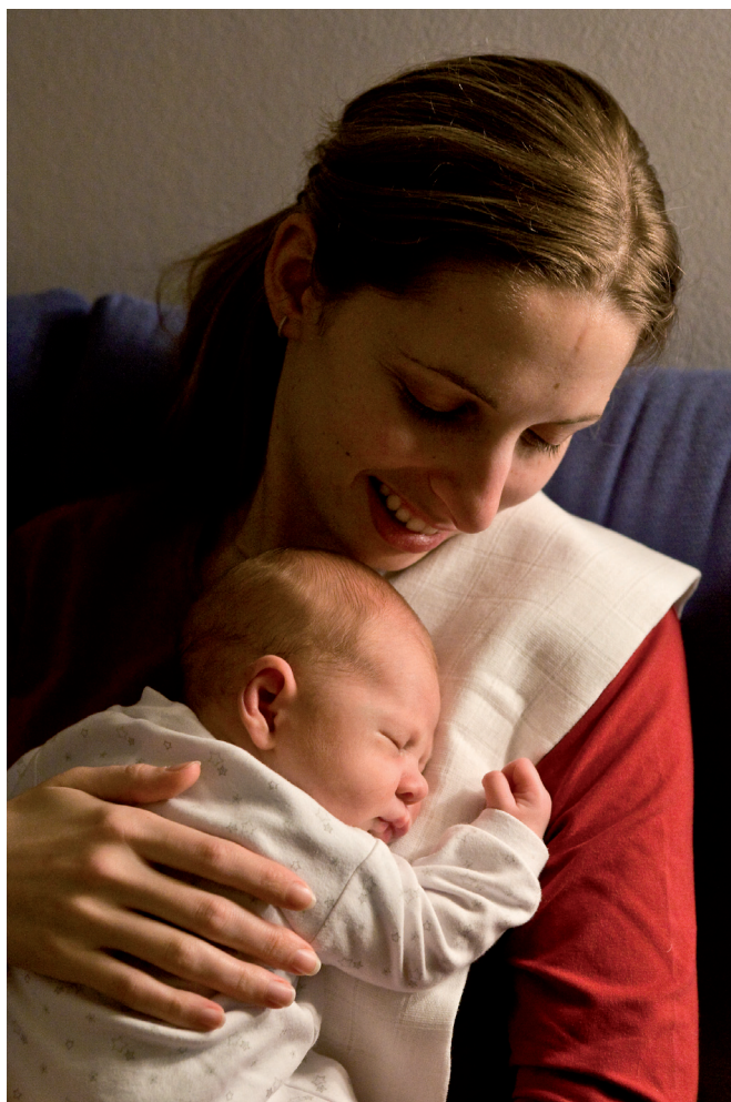
Obrázek 2.17 | Po jídle.

U těch úplně nejmenších dětí je jejich přirozený denní rytmus prakticky jedinou příležitostí, jak je na fotografiích zachytit při různých činnostech. Čas fotografování musíte volit podle toho, co chcete, aby dítě na fotografii dělalo, a musíte věci plánovat předem, abyste daný čas dokázali využít. Například pokud chcete fotografovat spící dítě, je dobré si předem rozmyslet, co přesně má mít na sobě oblečené a kde ho chcete nechat usnout, abyste