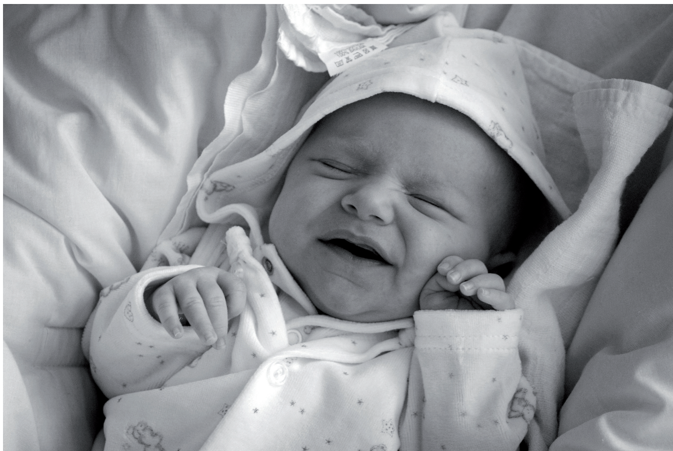
Obrázek 2.3 | Bětka, 5 týdnů.

Schopnost novorozeněte vědomě pózovat je nulová a i schopnost reagovat na různé podněty je zatím jen velmi omezená. Dokáže už ale projevít, když se mu něco nelíbí. To znamená, že vaším hlavním úkolem je při fotografování zajistit, aby novorozeně bylo spokojené. Vaším hlavním pomocníkem, co se různých poz týká, je přirozený denní rytmus dítěte – spánek, krmení, období bdělé aktivity, koupání atd.