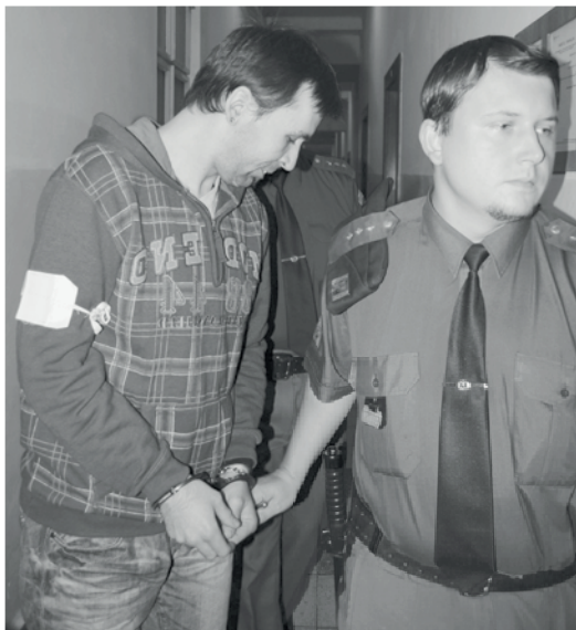
Vrah skončil na Mírově.

„Vím o svědkovi, který by do případu vnesl nové světlo,“ prohlásil Václavek, když znovu stanul před krajským soudem. Naznačil, že se na zločinu mohly nepřímo podílet i další osoby. „Nechci se však vyhýbat trestu, to ne!“ ujistil soudce.