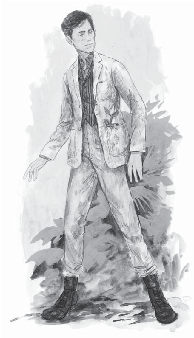
SKICI KOSTÝMŮ MLOKA SCAMANDERA