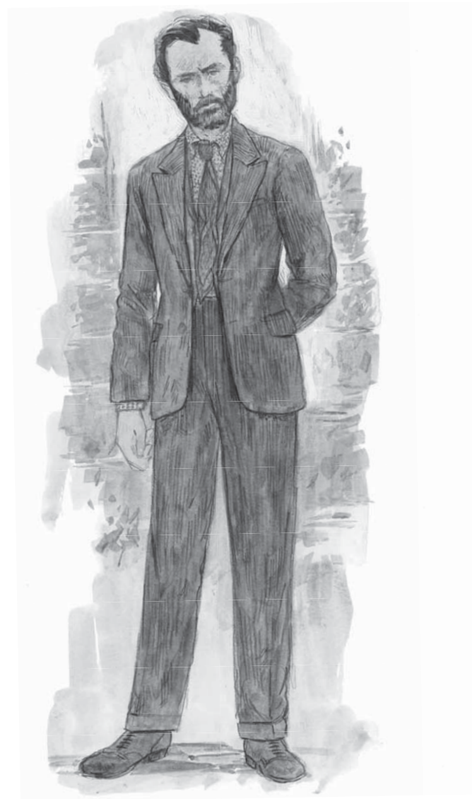
SKICA KOSTÝMU ALBUSE BRUMBÁLA