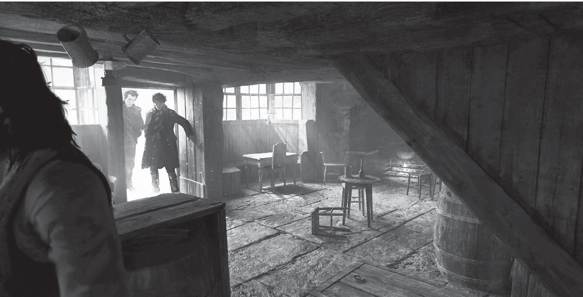
U PRASEČÍ HLAVY - RENDER LOKACE