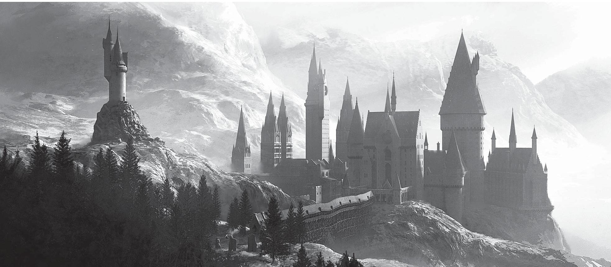
EXTERIÉR BRADAVIC – RENDER LOKACE