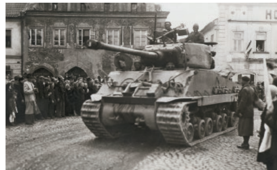
▪ Osvobození Sušice americkou armádou v květnu 1945.