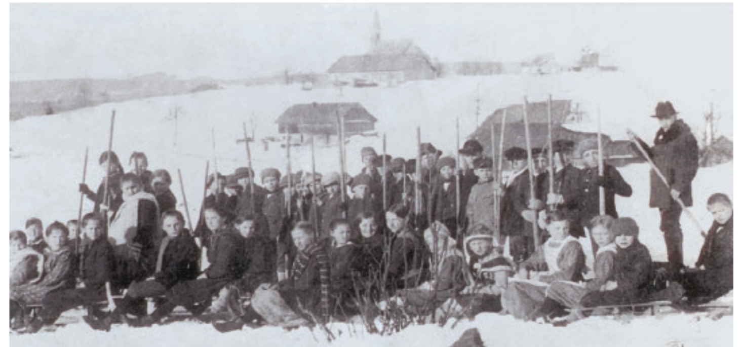
▪ Děti z místní školy s panem učitelem.