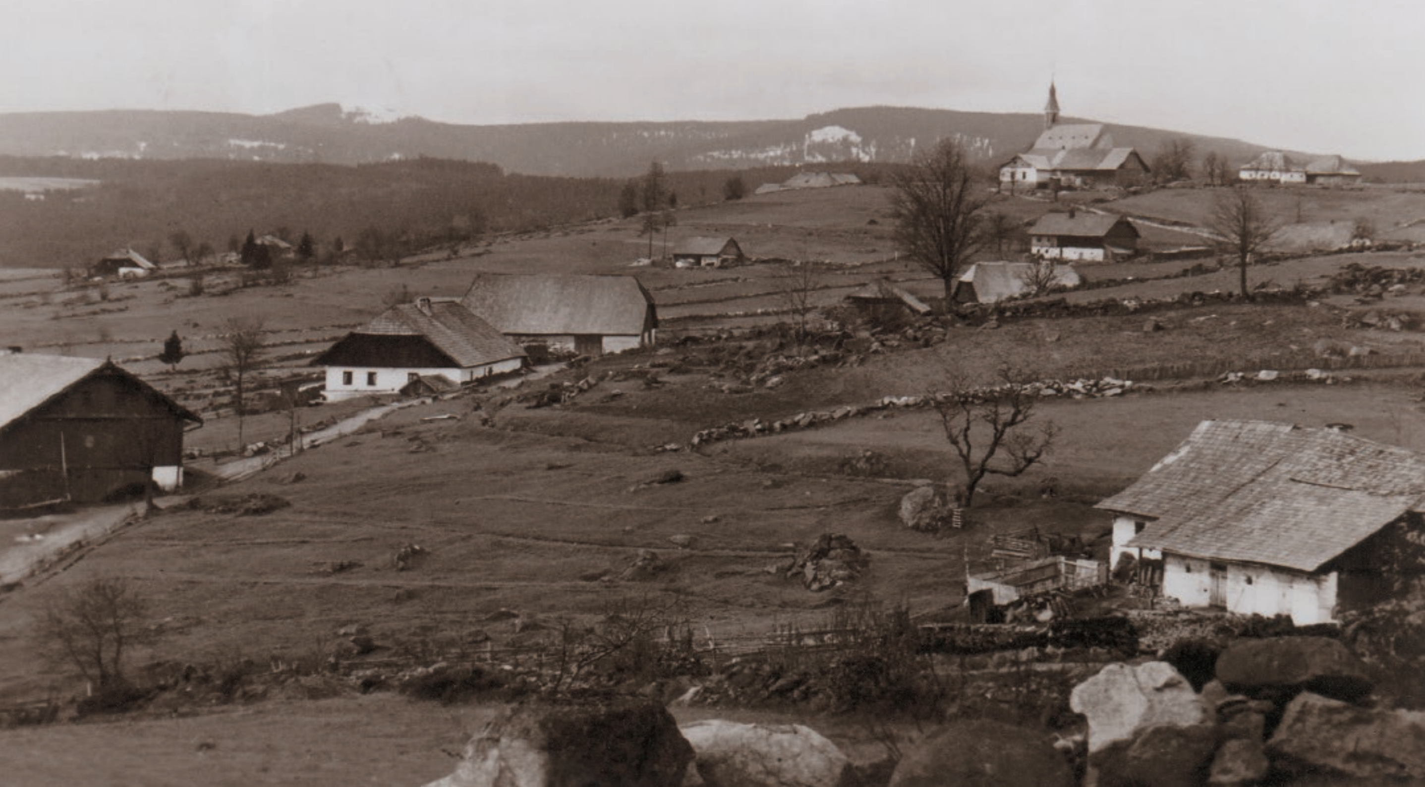
■ Knížecí Pláně s dominantou na kopci, kostelem sv. Jana Křtitele.