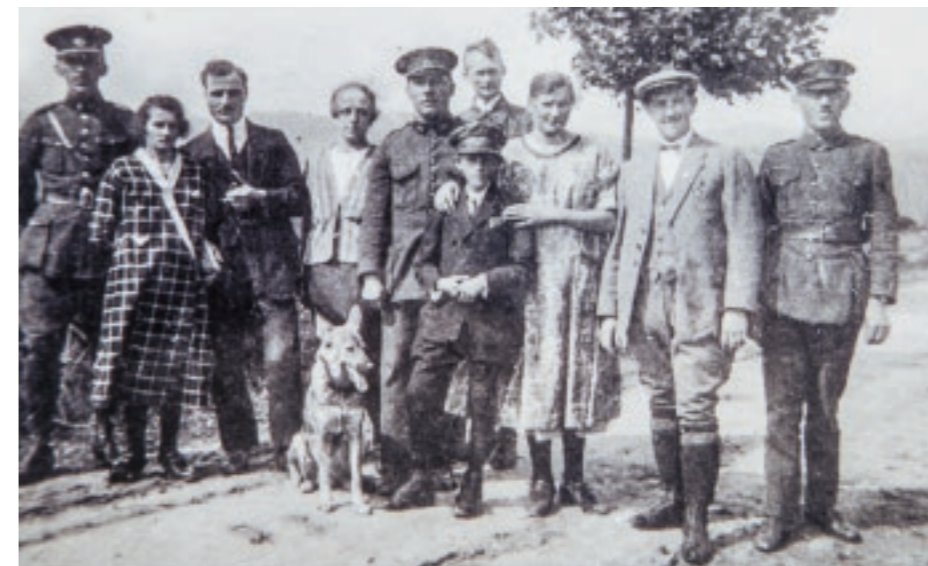
▪ Finanční stráž neboli financové patřili neodmyslitelně k tomuto kraji. Hranice s Bavorskem byla na dohled.