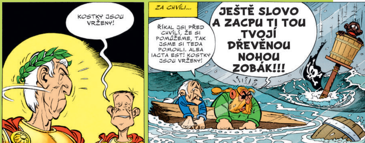
Asterix u Belgů (s. 39)