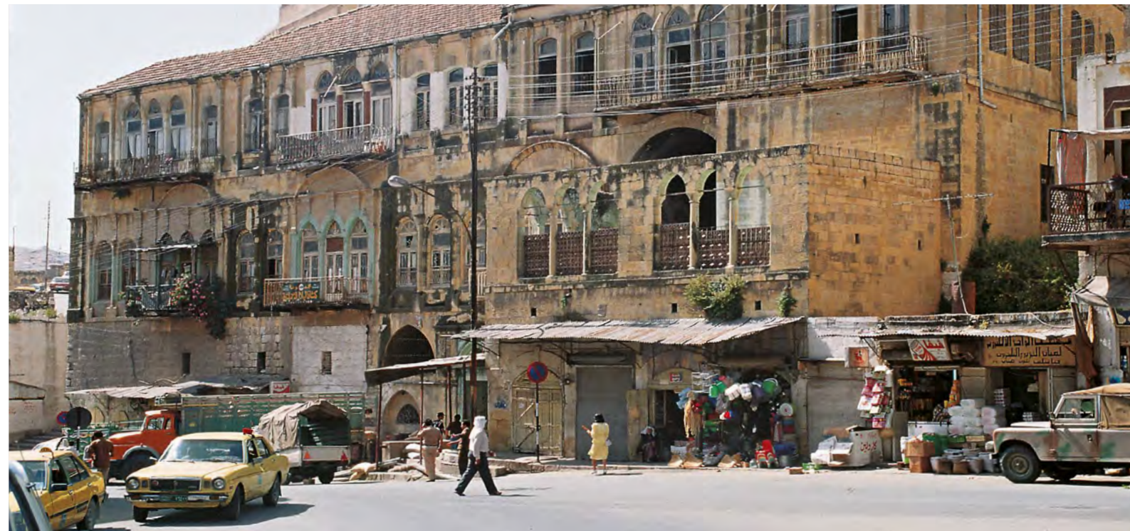
1. Ulice v dnešním Irbidu, Jordánsko, 7 km severovýchodně od starověkého města Am (dnešní Hám).