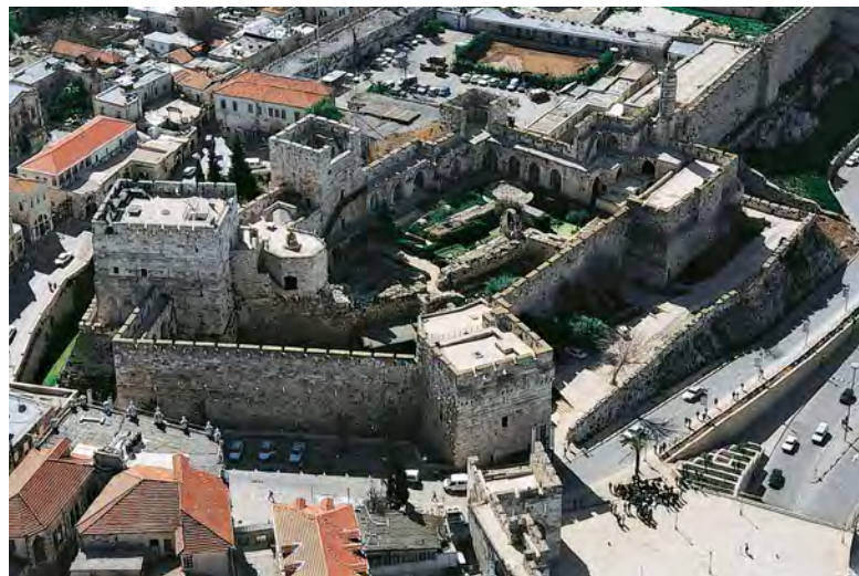
2. Letecký pohled na jeruzalémskou pevnost (Citadelu).