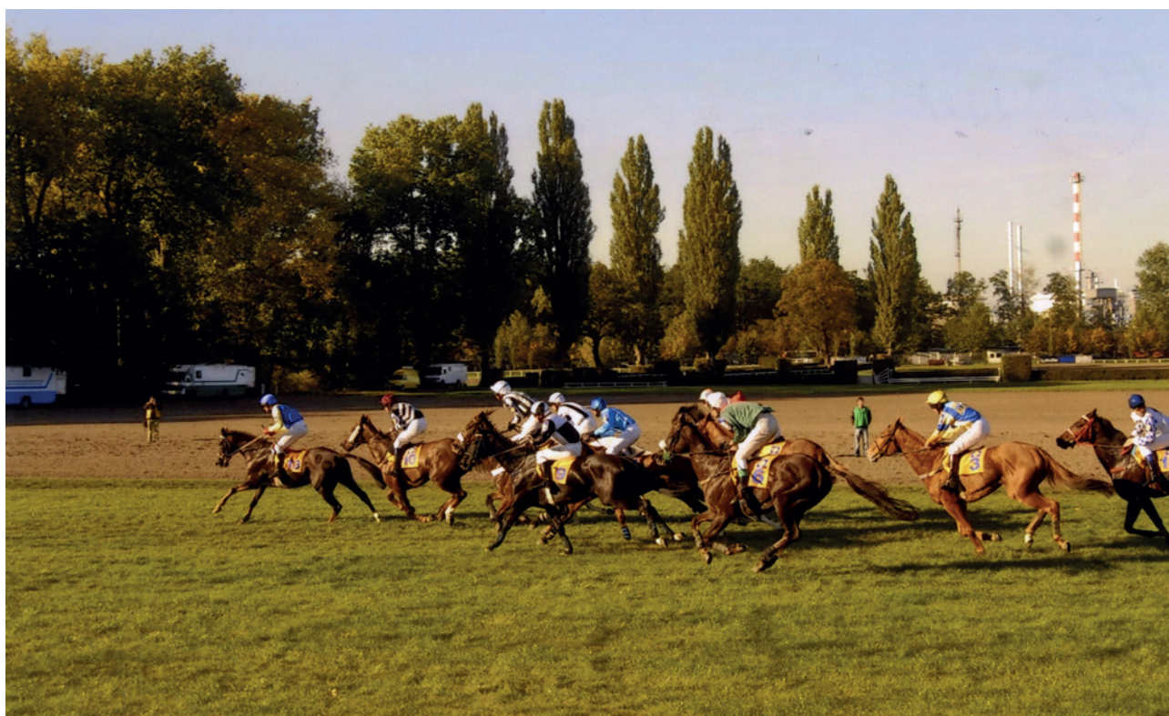
Pole míří od Taxisova příkopu k Irské lavici v roce 2007, už bez favoritů Maskula a Cieszymira. (Jiří Bělohlav)

Přes Irskou lavici převedli pole Ivoire de Beaulieu a Zeerow, ale vzápětí se do čela prodrál Decent Fellow a zůstal tam po většinu dostihu. Kolem lesíka cválali na čtvrtém a pátém místě Polárník a Sixteen, všichni přešli dobře, i když ne zcela čistě Francouzský skok a v sevřeném poli s minimálními rozeztupy se blížili k Malým zahrádkám. Ani Maskul bez jezdce, ani ostrovní koně, pro které tento dvojskok bývá kamenem úrazu, tentokrát nezaváhali. Po desáté překážce všichni jezdci zpomalili a úsek přes „náměstí“ absolvovali v odpočinkovém tempu, snad aby příliš nepoplašili malé hejno havranů, kteří se tento podzim objevili v Pardubicích dřív než obvykle. Na Prodlouženém