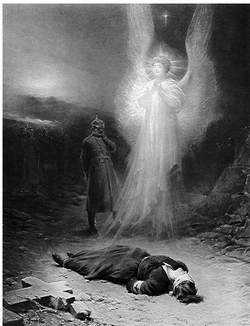
Vyobrazení smrti Edith Cavellové na dobové pohlednici

bojujících proti Němcům. Mnozí z nich se nevědomky stávali vyzvědači, když přinášeli spojeneckým velitelům důležité informace o nepřátelské armádě a stavu v týlu. Německá kontrašpionáž tušila, že slečna Cavellová sympatizuje se Spojenci. Snažila se ji hlídat, rovněž tak nemocnice a zdravotní školu. Na žádné její pochybení či nepřátelskou činnost však nepřišla.