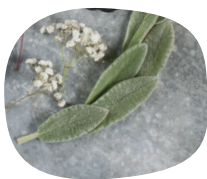
7 listů čistce