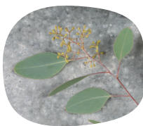
Listy a tobolky blahovičniku