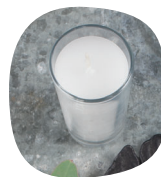
1 sklenice se svíčkou