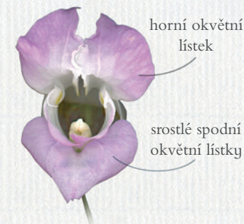
horní okvětní lístek