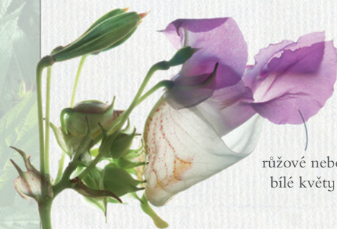
růžové nebo bílé květy