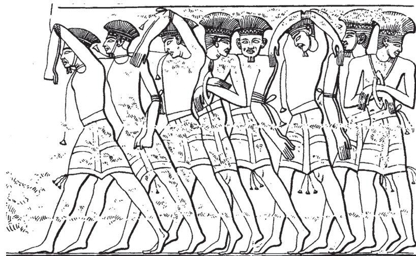
Příslušníci Mořských národů, zobrazení jako zajatci v Medínit Habu

Ramesse na stěnách svého zádušního chrámu v Medínit Habu nedaleko Údolí králů výstižně uvádí: