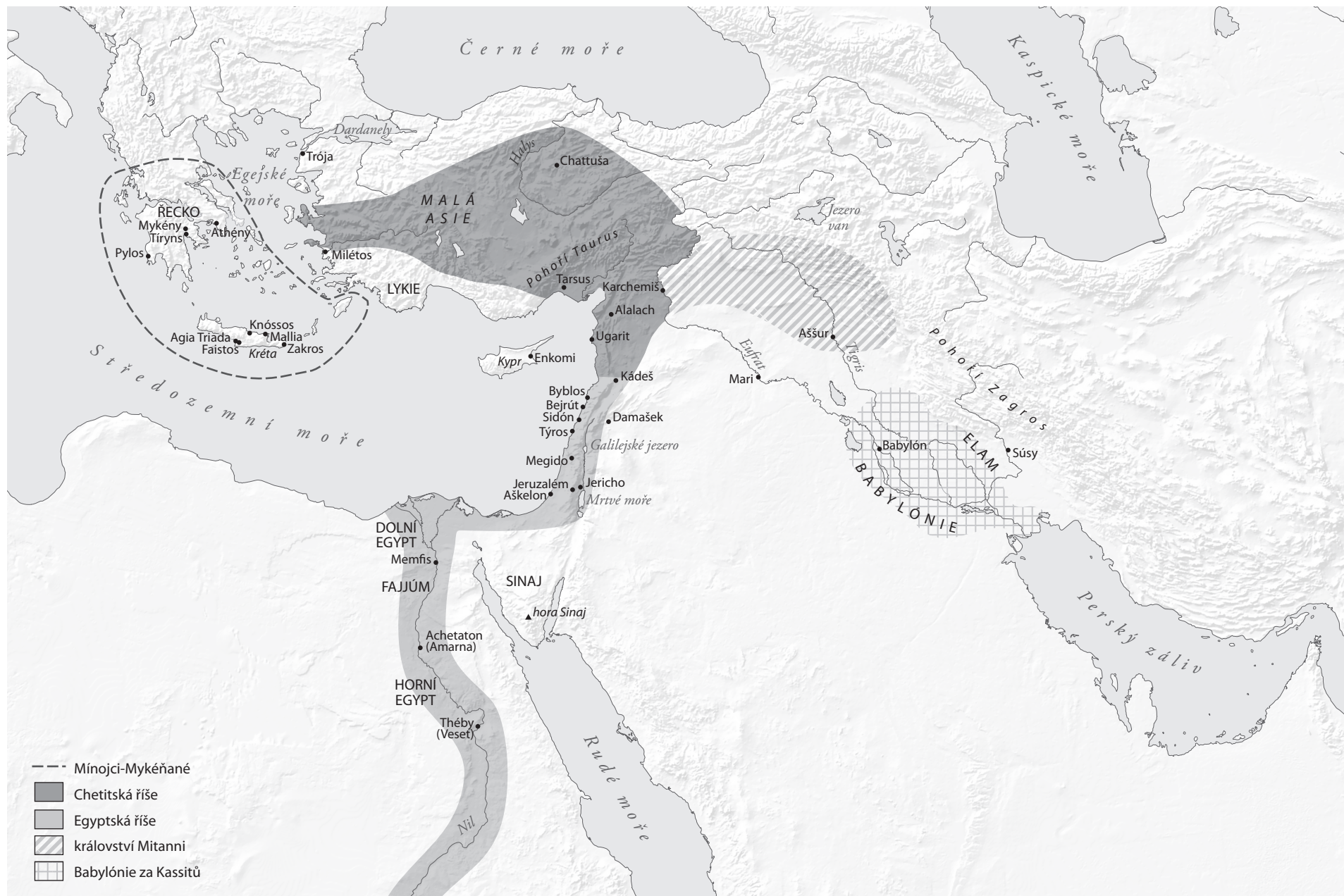
Mapa civilizací pozdní doby bronzové v Egeidě a východním Středomoří