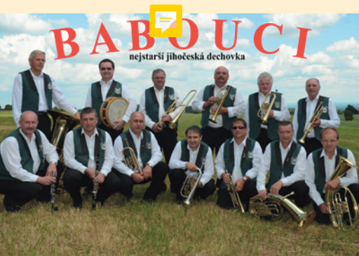
Každý Babouk musí umět nejen perfektně hrát, ale i zpívat.