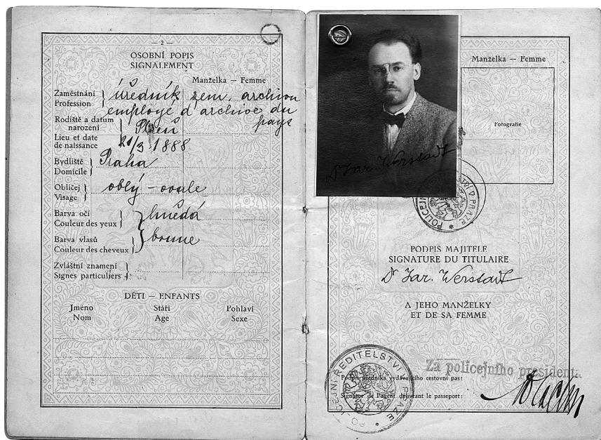
Cestovní pas vydaný 23. července 1923.