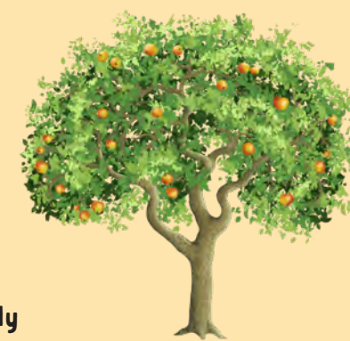
jablň s plody

Ovocné stromy pěstujeme my lidé zejména kvůli sladkému a lahodnému ovoci či ořechům. Kromě toho slouží jako úkryt či zdroj potravy řadě drobných živočichů, například hmyzu nebo ptákům.