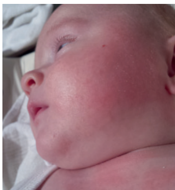
Začátek ekzému u našich synů

Každé dítě je jiné a jiný je i průběh jeho ekzému. Ekzém se může vyskytovat jen v mírné formě . Dítěti se tvoří suchá místa po těle, která stačí pravidelně hydratovat. Vaše miminko může vypadat na první pohled normálně, ale vy při hlazení cítíte na jeho tělíčku hrubší místa. Po koupání či po kontaktu dítěte