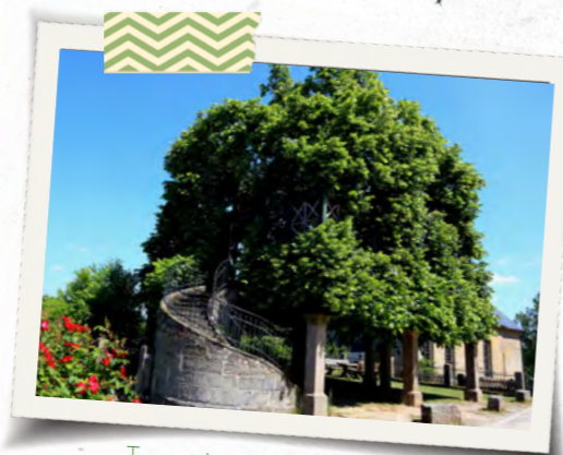
Taneční lípa v bavorském Peesten