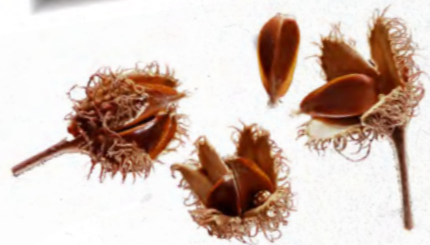
Syrové bukvice nejezte, jsou lehce jedovaté a můžou přivodit bolesti břicha.