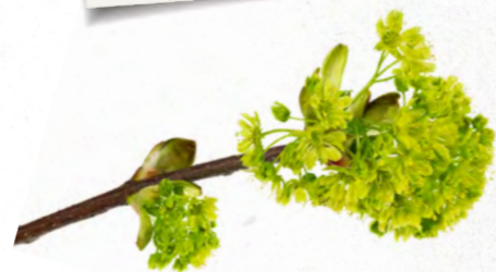
Květy raší dříve než listy.