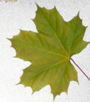
Laloky listů jsou ostře špičaté.