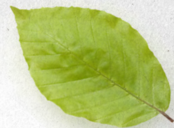
Okraje listů jsou lehce zubaté.