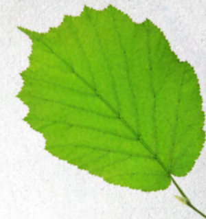
Listy jsou dvojitě pilovité s krátkou špičkou.

mohou vyklíčit a vyrůst v nový lískový keř.