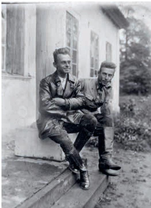
Witold Pilecki a jeden z jeho přátel v Sukurcze někdy kolem roku 1930