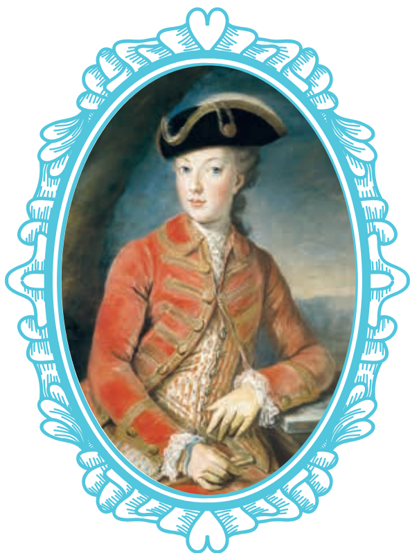
Marie Antoinetta v jezdeckém úboru na portrétu z roku 1771.

Ve snaze zaplnit prázdnotu svých dní, uniknout odsudkům a nalézt trochu svobody se Marie Antoinetta vrhla na jezdectví. Úbor, který ke koním nosila, však popíral všechny dobré mravy: dámy totiž jezdecké kalhoty, pokud je vůbec nosily, zakrývaly sukněmi. Marii Antoinettě se ale více zamlouvalo mužské jezdecké oblečení. Také ráda vyrážela na hony, od čehož ji ovšem na dvoře odrazovali. Když ji v roce 1771 její matka požádala, aby se dala portrétovat, nechala se vítězoslavně zpodobnit ve svém jezdeckém úboru na koňském hřbetu. Obraz nápadně připomínal věhlasný portrét Ludvíka XIV., přezdívaného král Slunce, a ze strany Marie Antoinetty šlo o poměrně provokativní vizuální převzetí moci.