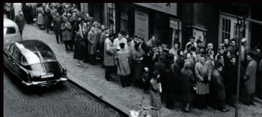
Tahle fronta nestojí na maso, nýbrž na kulturu