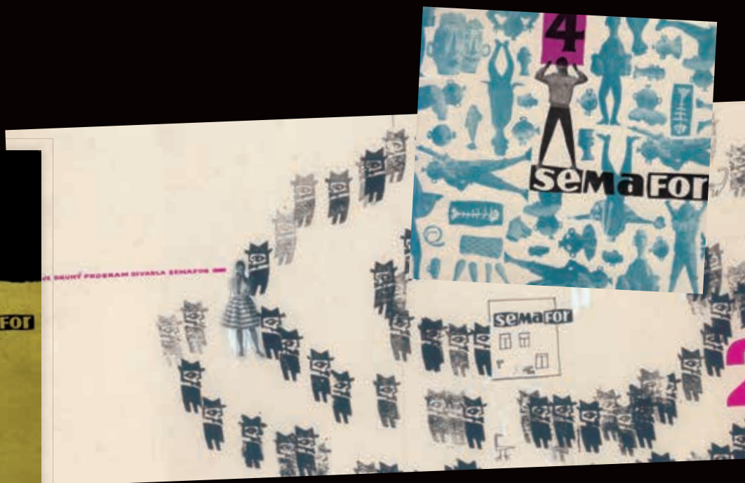
Obálky divadelních programů navrhovala Běla Suchá