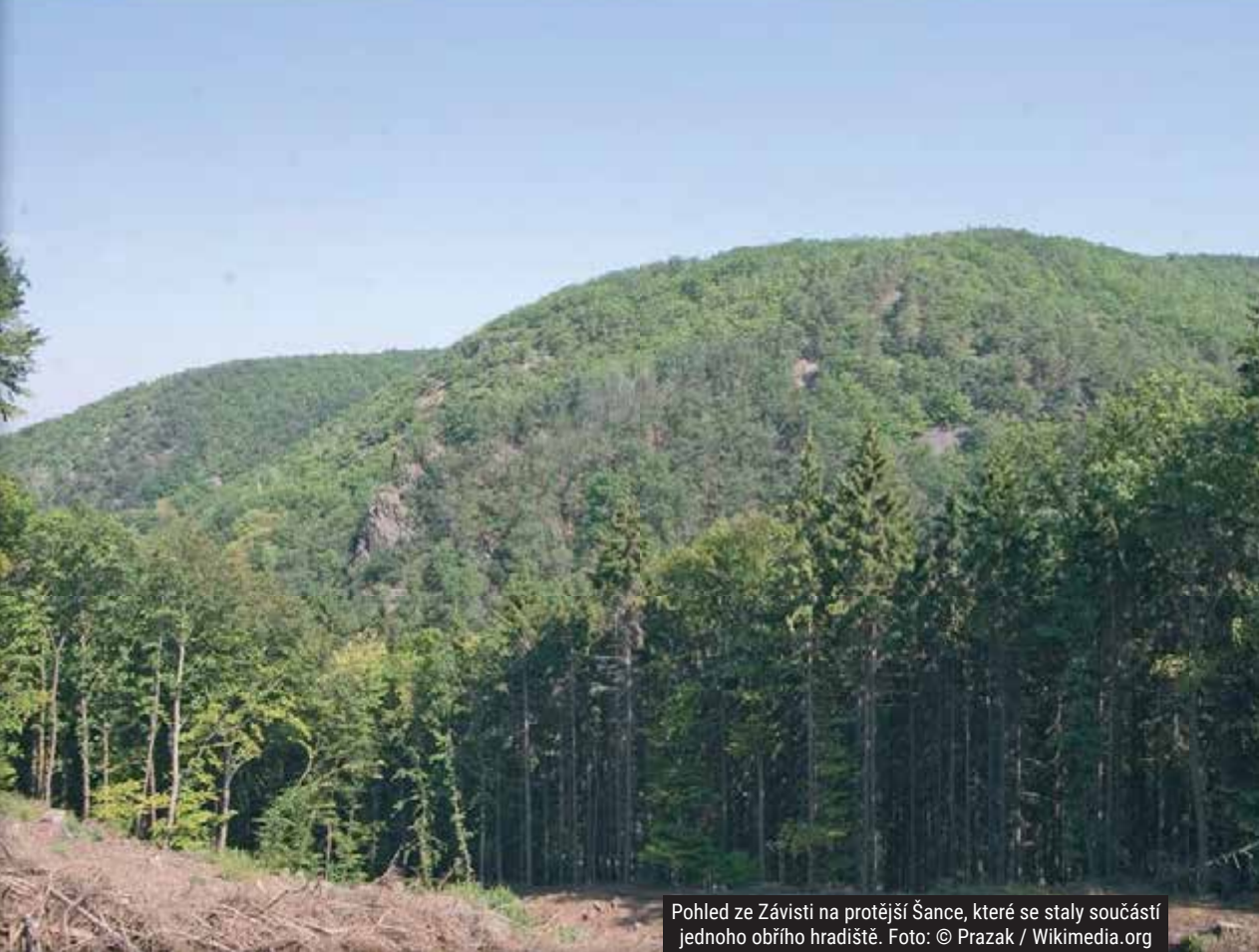
Pohled ze Závisti na protější Šance, které se staly součástí jednoho obřích hradiště.

podobu s dřevěnou konstrukcí. Stará šíjová brána ustoupila nové s nápadnými nárožními kamennými bastiony, patrně inspirovanými antickým vzorem. Toto opevnění v tu dobu již chránilo prostor o rozloze více než 80 hektarů.