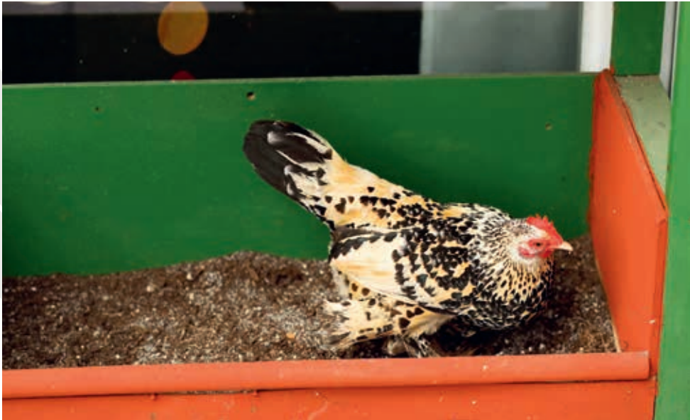
Místo k popelení je pro Lunu nejoblíbenějším místem

Slepice k udržení zdraví musí mít možnost „koupat“ se neboli popelit se v suché hlíně, písku, popelu (více na str. 28). Za deštivého počasí nebo jsou-li slepice drženy v uzavřených prostorách, musí mít možnost popelit se přímo v kurníku. Postavte dovnitř dřevěnou bedýnku asi 20–30 cm vysokou, naplňte ji prosátou zeminou – a problém je vyřešen!