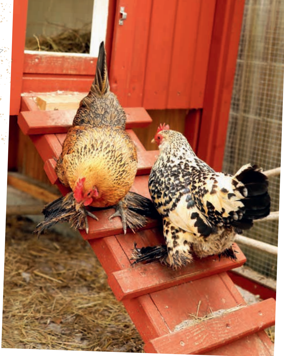
Luna nahoru, Koko dolů, tlačence na žebříku