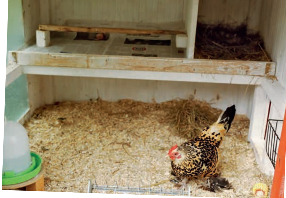
Účelný malý kurník s hřadou, kukaněmi, žlabem a s vyvýšenou napáječkou