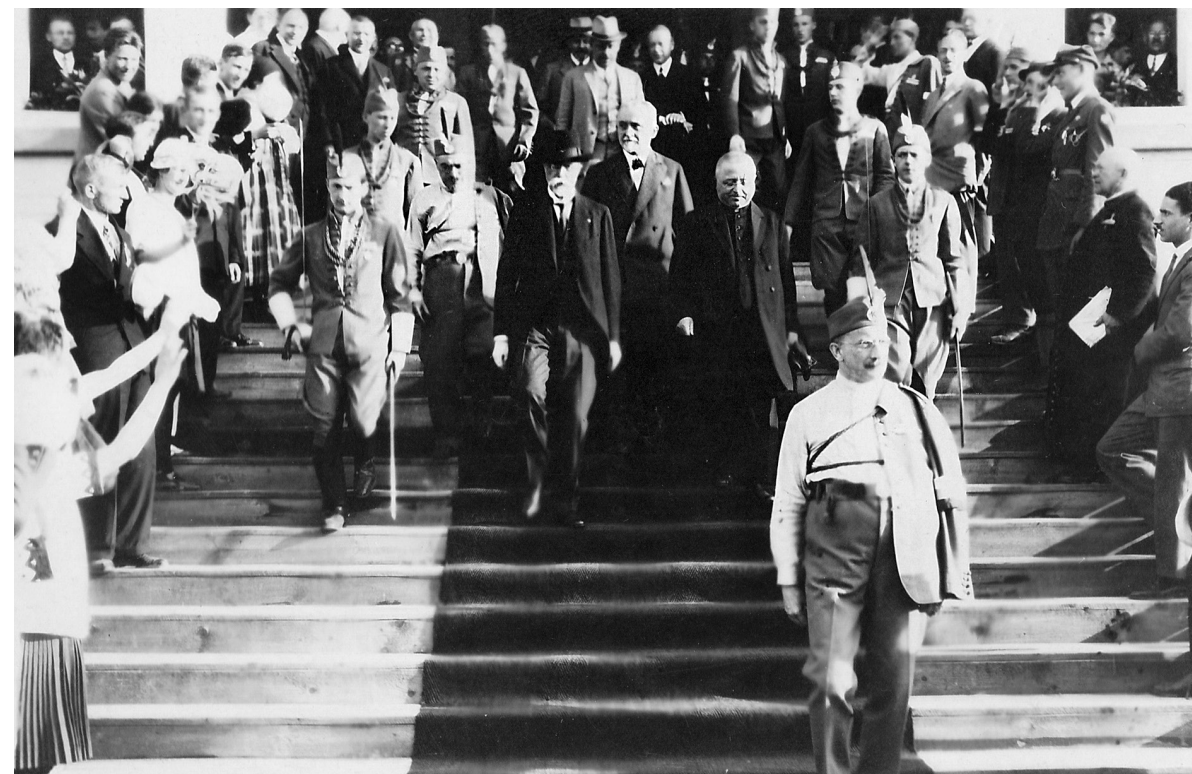
Tomáš Garrigue Masaryk navštěvuje svatováclavskou slavnost v roce 1929... „Velmi pěkně to popsal Petr Placák v knize Svatováclavské milénium: Češi, Němci a Slováci v roce 1929 , která se zabývá obdobím, kdy vlastně naposledy jednotlivé národní katolické společnosti, či lépe – katolíci z jednotlivých národních táborů – slavili pohromadě.“

Existují různé typy vlastenectví. Zemské vlastenectví, které je typické zejména pro monarchistické elity, pro šlechtu, za první republiky nebylo, bohužel, moc pěstováno.