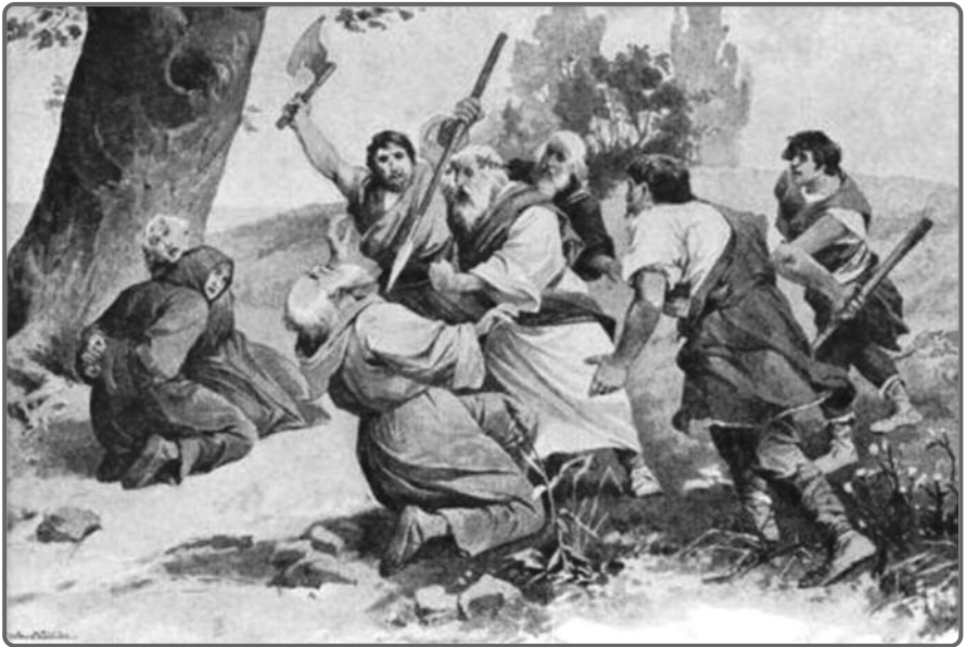
Zavraždění biskupa Vojtěcha na jeho misionářské cestě v pohanském Prusku (obraz Věnceslava Černého).

Tento německý panovník byl totiž vzdělaný, zbožný a okamžitě poznal, že má před sebou stejně vzdělaného, a navíc moudrého muže, s nímž mohl otevřeně diskutovat o čemkoli – o církevních otázkách i politice. Vojtěcha se od jeho rozhodnutí působit mezi pohanskými Prusy snažil přemluvit, neboť o nich kolovaly zvěsti, že s křesťany nemají slitování, ale biskup už byl rozhodnutý. Půjde právě tam, ať už se stane cokoli.