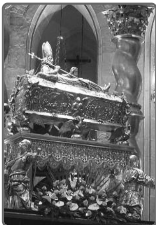
Náhrobek s ostatky svatého Vojtěcha v polském Hnězdně.

Z Německa pak zamířil k polskému panovníkovi Boleslavu Chrabrému, kde se chtěl setkat s bratrem Soběslavem, který zde po libické tragédii našel azyl. Soběslav žádal polského krále, dávného spojence a přítele Slavníkovců, aby mu dal k dispozici vojsko. S ním chtěl vtrhnout do Čech a pomstít se Přemyslovcům a Vršovcům za masakr na Libici. Ale Boleslav Chrabrý váhal svou vlastní vojenskou intervenci proti českému knížeti sice sám plánoval, ale zatím měla ještě několik let počkat.